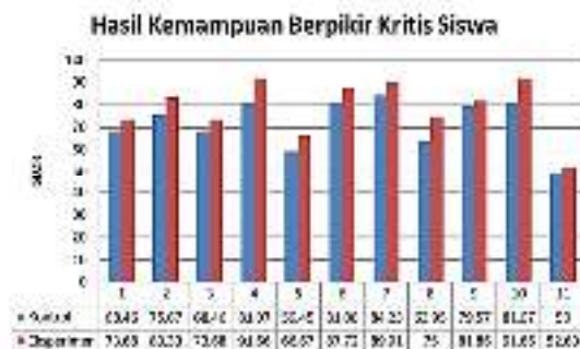
Gambar 3. Hasil kemampuan berpikir kritis siswa

Usman (1992) mengungkapkan beberapa aktivitas belajar siswa pada metode diskusi kooperatif tipe STAD yaitu menemukan masalah yang layak didiskusikan, menjelaskan masalah, mengajukan pendapat, melakukan tanya jawab, mengarahkan situasi sesuai topik bahasan, mengemukakan solusi dari permasalahan, dan menyimpulkan. Siswa dikatakan memiliki kemampuan menyimpulkan dan mengidentifikasi asumsi-asumsi jika dalam menjawab pertanyaan siswa dapat memberikan jawaban dengan alasan yang tepat dari persoalan yang disampaikan baik secara umum maupun khusus (Ernest, 1991). Kemampuan mendefinisikan istilah dan mempertimbangkan suatu definisi dapat dilihat ketika siswa mampu mengemukakan arti atau makna istilah, simbol maupun rumus yang mereka kerjakan untuk menjawab suatu permasalahan. Siswa dikatakan mampu menjaga situasi dalam berpikir kritis jika dalam menanggapi pertanyaan tidak melenceng jauh dari topik yang ditanyakan. Jadi mereka membicarakan hanya dalam ranah materi atau konsep yang berhubungan dengan pertanyaan saja. Aktivitas ini berkaitan dengan indikator menentukan suatu tindakan (Julie & Dorothy, 2007).