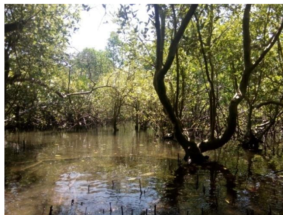
Gambar 4. Ekosistem mangrove alami Pemongkong, Lombok Timur

2019). Usia vegetasi mangrove Pemongkong diperkirakan sudah cukup tua dilihat dari diameter pohon S. alba yang ditemukan mencapai 50 cm. Menurut Nazim et al (2013) tumbuhan mangrove dengan ukuran dbh sekitar 18 – 32 cm memiliki usia sekitar 18-32 tahun dengan kecepatan tumbuh 1.15 \pm 0.17 cm/tahun (Aryanto et al , 2018). Vegetasi mangrove Gerupuk sendiri merupakan hasil rehabilitasi dan sebagian besar masih pada tipe pertumbuhan pancang atau pohon kecil. Usia vegetasi ini juga berkaitan dengan stabilitas ekosistem. Komunitas mangrove Pemongkong merupakan komunitas klimaks yang sangat stabil jika tidak ada gangguan yang cukup besar. Jika dibandingkan, komunitas mangrove Gerupuk masih berada dalam tahap inhibisi dan fasilitasi atau peremajaan sehingga belum cukup stabil (Zvonareva et al , 2015, Anwar dan Mertha, 2017; Molles dan Sher, 2019).