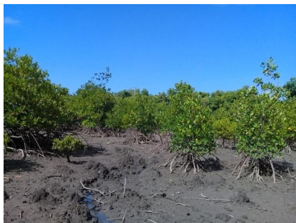
Gambar 3. Ekosistem mangrove rehabilitasi Teluk Gerupuk, Lombok Tengah

Usia vegetasi mengacu pada stabilitas dari suatu ekosistem (Smith dan Smith, 2012; Molles dan Sher,