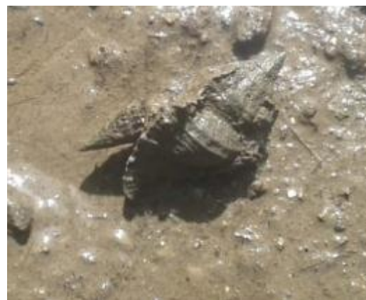
Gambar 2. C. capunicus sedang memakan Cerithidea sp. di ekosistem mangrove Gerupuk

(Assimineidae) dan Chicorius capunicus (Muricidae). Keduanya termasuk kelompok moluska asli mangrove yang persebarannya meliputi kawasan belakang hutan mangrove (Abbott dan Dance, 1991; Budiman, 2009; Goltenboth et al. , 2012). Selain itu, kelimpahan C. capunicus yang merupakan moluska karnivora yang bersifat oportunistis cenderung disebabkan karena kelimpahan jenis moluska lain termasuk Cerithidea spp. sebagai sumber makanannya di lokasi penelitian (Phintrakoon et al. , dalam Mujiono, 2016). Baharuddin et al. (2018) juga melaporkan bahwa gastropoda predator seperti Muricidae dapat ditemukan di seluruh zona dengan kelimpahan moluska tinggi.