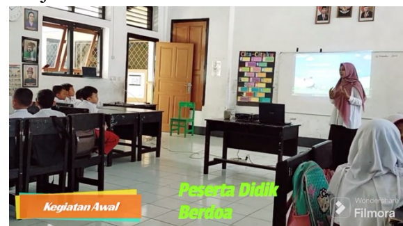
Gambar 1a. Peserta didik berdo'a untuk memulai kegiatan

Hasil kegiatan pengabdian kepada masyarakat berupa aktivitas penerapan model pembelajaran berbasis masalah dan pemanfaatan media pembelajaran bola jumper ditunjukkan Gambar 1.