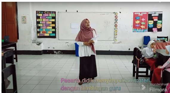
Gambar 1m. Guru membimbing peserta didik menyimpulkan materi