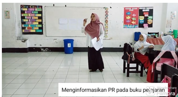
Gambar 1n. Guru memberikan informasi tugas rumah

Hasil kegiatan menunjukkan bahwa nilai rata-rata KBTT siswa sebesar 86, dengan nilai tertinggi sebesar 100 dan nilai terendah sebesar 60. Nilai siswa dapat dilihat pada Gambar 2.