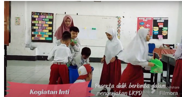
Kegiatan Inti Peserta didik berlibat dalam mengerjakan LKPD