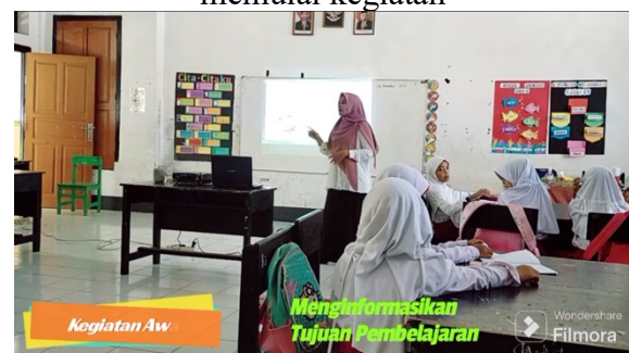
Gambar 1b. Guru menyampaikan tujuan pembelajaran