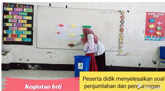
Kegiatan Inti Peserta didik menyelesaikan soal penjumlahan dan pengurangan