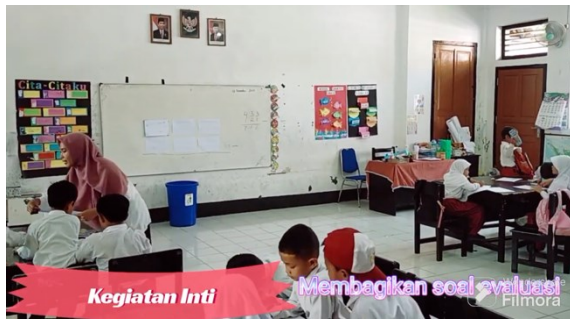
Gambar 1k. Guru memberikan evaluasi