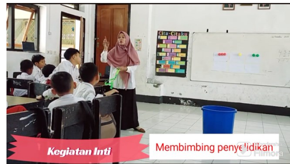
Kegiatan Inti Membimbing penyelidikan kelompok