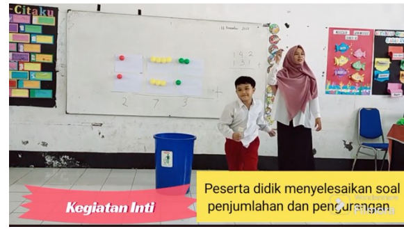
Kegiatan Inti Peserta didik menyelesaikan soal penjumlahan dan pengurangan