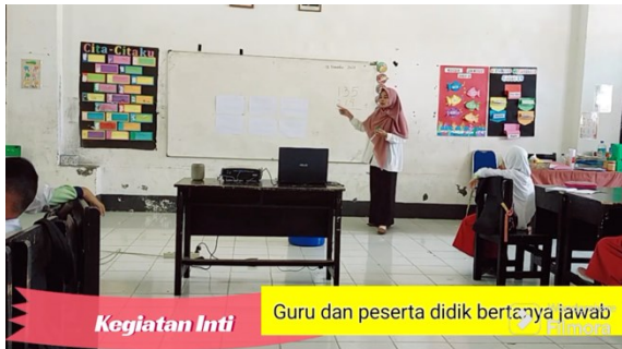
Kegiatan Inti Guru dan peserta didik bertanya jawab