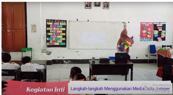
Kegiatan Inti Langkah-langkah Menggunakan Media Bola Jumper