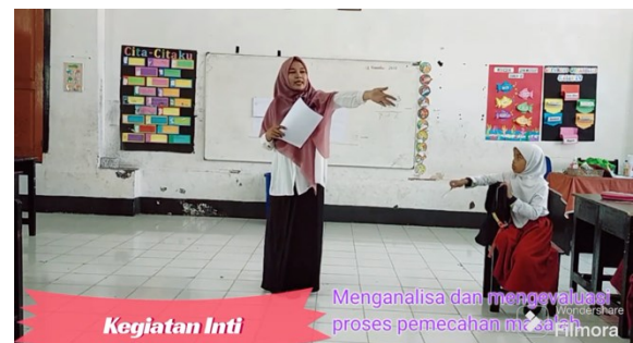
Kegiatan Inti Menganalisa dan mengevaluasi proses pemecahan masalah