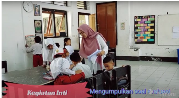
Gambar 1l. Guru mengumpulkan soal evaluasi