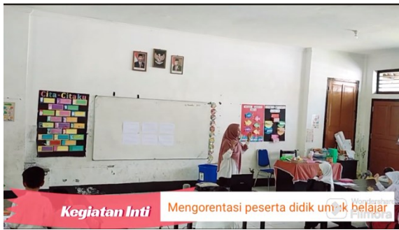
Kegiatan Inti Mengorientasi peserta didik untuk belajar