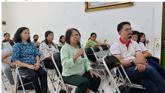
Gambar 5. Sesi tanya jawab

Kegiatan dilanjutkan dengan tanya jawab dan sharing oleh salah satu orang tua yang anaknya sudah bisa lepas dari botol dot dan diakhiri dengan sesi tanya jawab seluruh peserta dengan pembicara. Dalam kegiatan parenting ini para peserta yang hadir tampak antusias dan sangat terbantu dengan adanya acara penyuluhan serta memberikan respon yang sangat baik dalam setiap pertanyaan dan pernyataan yang disampaikan oleh orang tua kepada pembicara.