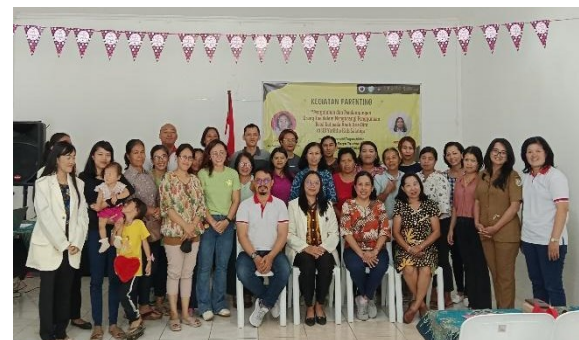
Gambar 6. Foto bersama

Dengan adanya kegiatan pendampingan terdapat tingkat kemajuan dan pembiasaan yang baik dari segala upaya orang tua yang telah dilakukan.