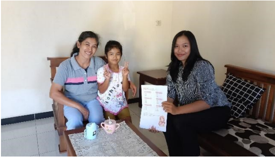
Gambar 8. Saat kunjungan ke rumah anak