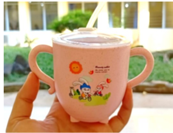
Gambar 2. Gelas hisap

Dari kegiatan parenting terdapat tindak lanjut yaitu pemberian gelas hisap dan checklist keterlaksanaan sebagai salah satu solusi yang diberikan kepada orang tua untuk memberikan susu kepada anak sebagai ganti botol dot. Dengan adanya gelas hisap ini diharapkan orang tua dapat memberikan pendampingan kepada anak yang masih sulit untuk lepas dot dan masih menggunakan botol dot saat minum susu.