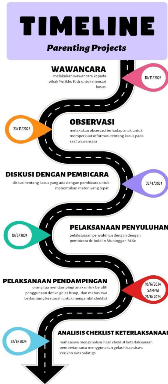
Gambar 1. Timeline kegiatan

Dari kegiatan parenting terdapat tindak lanjut yaitu pemberian gelas hisap dan checklist keterlaksanaan sebagai salah satu solusi yang diberikan kepada orang tua untuk memberikan susu kepada anak sebagai ganti botol dot. Dengan adanya gelas hisap ini diharapkan orang tua dapat memberikan pendampingan kepada anak yang masih sulit untuk lepas dot dan masih menggunakan botol dot saat minum susu.