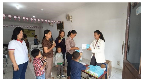
Gambar 7. Pembagian gelas hisap dan checklist