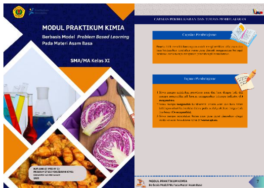
Gambar 1. Desain Pendahuluan

Format yang dirancang pada modul praktikum berbasis Problem Based Learning mencakup cover modul praktikum, kata pengantar, daftar isi, deskripsi modul praktikum, petunjuk penggunaan modul praktikum, pengenalan alat dan bahan laboratorium, tujuan pembelajaran dan capaian pembelajaran, materi asam dan basa, kegiatan pembelajaran I dan II soal evaluasi, glosarium dan daftar pustaka. Perancangan awal mengacu pada media yang disusun sebelum menjalankan uji coba, sehingga modul praktikum yang dihasilkan pada tahap ini disebut sebagai prototype 1. Media yang dirancang memiliki format pendahuluan, isi dan penutup yang ditunjukkan pada gambar berikut.