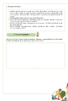
Gambar 6. LKPD Bagian Menguji Hasil

PowerPoint diganti dengan pembuatan poster. Berikut tampilan LKPD sesuai saran validator ahli.