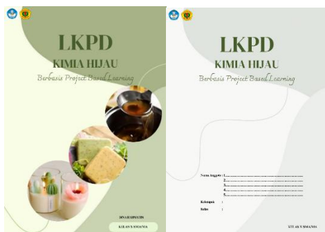
Gambar 1. LKPD Bagian Sampul