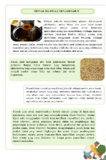
Gambar 5. LKPD Bagian artikel