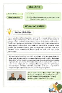
Gambar 4. LKPD Bagian Pertemuan 1 dan 2