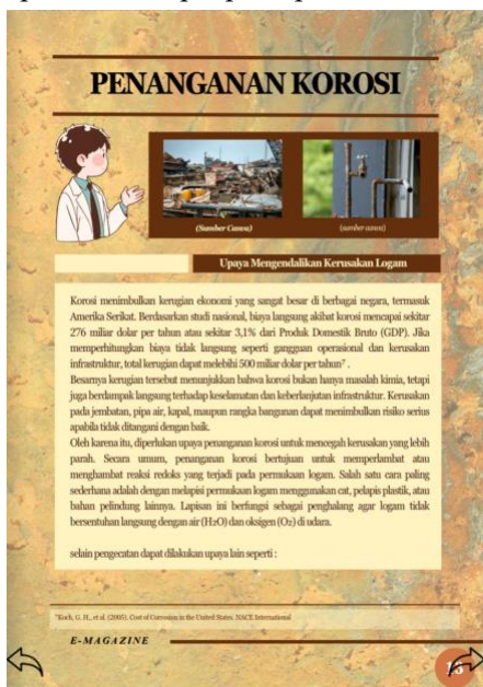
Gambar 3. Konten Socio-Scientific Issues (SSI) dampak ekonomi korosi global

Desain e-majalah mengacu pada prinsip multimedia learning (Mayer, 2009) dan prinsip desain visual instruksional (Smaldino dkk., 2019).