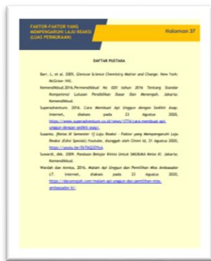
Gambar 3. Daftar Pustaka

Gambar 3 merupakan halaman akhir dari LKPD. Berisi daftar-daftar rujuka yang digunakan pada LKPD.