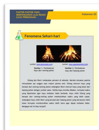
Gambar 2. Isi

Gambar 1 merupakan halaman awal yang berisi pemetaan kompetensi dasar, kompetensi inti, indeks pencapaian kompetensi, dan tujuan pembelajaran.