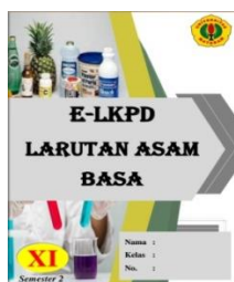
Gambar 1. Sampul E-LKPD Larutan Asam Basa

Penampakan halaman judul tertera pada Gambar 1.