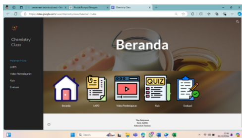
Gambar 1. Tampilan Beranda