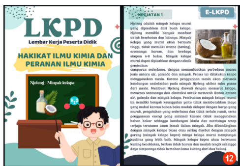
Gambar 2. Tampilan LKPD