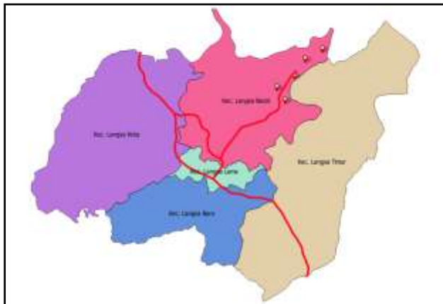
Gambar 1. Peta Lokasi Pengambilan Sampel Penelitian

Penelitian ini dilaksanakan kawasan mangrove sekitar Pelabuhan Kuala Langsa, Kota Langsa, Provinsi Aceh pada Bulan Juli – Agustus 2017 (Gambar 1). Metode yang digunakan dengan mengumpulkan data primer. Pengumpulan data primer dilakukan melalui pengamatan dan pengambilan sampel secara langsung.