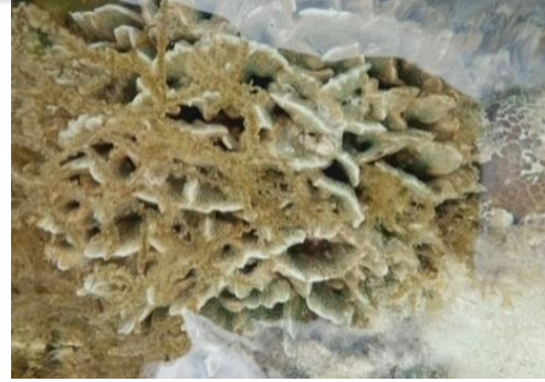
Gambar 4. Famili Marulinidae: Merulina scabricula