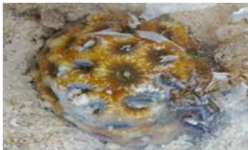
Gambar 4. Famili Leptastreidae; Leptastrea purpurea

Leptastrea purpurea menunjukkan tipe morfologi encrusting yang menyebar mengikuti permukaan substrat. Bentuk ini memungkinkan koloni melekat kuat pada substrat keras dan meningkatkan ketahanan terhadap gangguan fisik seperti gelombang. Secara ekologis, tipe pertumbuhan ini mencerminkan strategi adaptasi terhadap kondisi lingkungan dengan tekanan hidrodinamika tinggi serta kompetisi ruang yang intens (Alamsyah et al., 2022; Arrigoni, 2023).