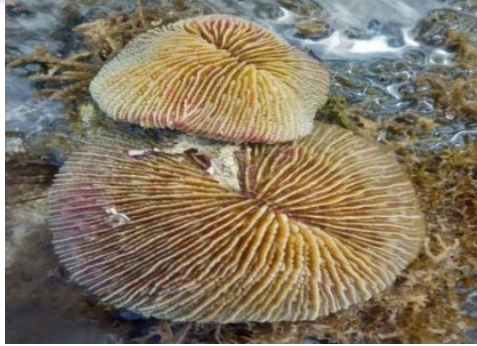
Gambar 3. Famili Fungiidae: Fungia sp.