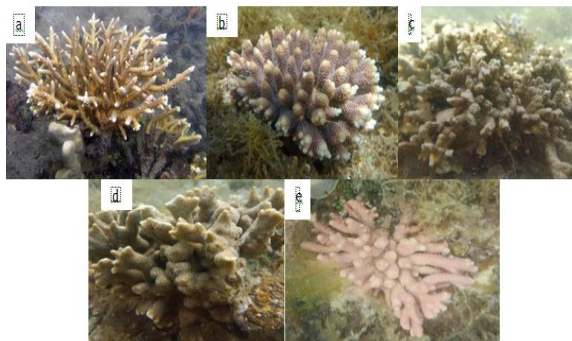
Gambar 1. Famili Acroporidae: a) Acropora aspera ; b) Acropora gemmifera ; c) Acropora donie ; d) Acropora perifera ; e) Acropora nobillis .

Famili Acroporidae yang diwakili oleh genus Acropora menunjukkan tipe morfologi bercabang dengan variasi bentuk pertumbuhan seperti arboresen, korimbosa, dan kapitosa (Candri et al., 2022); (John E. N. Veron et al., 2025). Struktur percabangan yang kompleks meningkatkan luas permukaan koloni, sehingga mendukung efisiensi fotosintesis zooxanthellae sebagai sumber energi utama bagi karang (Schmidt-roach et al., 2020). Dominansi morfologi bercabang pada lokasi penelitian menunjukkan adanya adaptasi terhadap lingkungan perairan dangkal dengan intensitas cahaya tinggi. Selain itu, bentuk percabangan memungkinkan karang tumbuh cepat dan bersaing dalam memperebutkan ruang. Pada penelitian ini, spesies Acropora umumnya ditemukan pada substrat pasir berbatu, yang menunjukkan bahwa stabilitas substrat berperan penting dalam menopang struktur koloni bercabang (Januar et al., 2023).