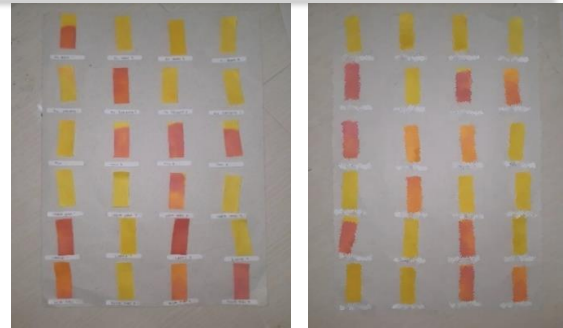
Gambar 2 Hasil uji kit boraks LABSTEST