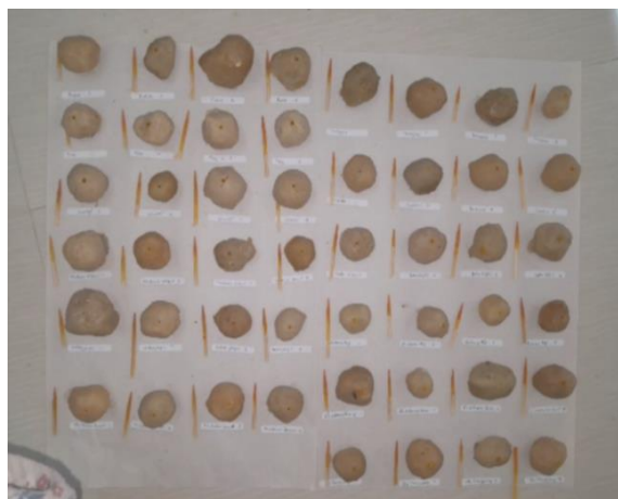
Gambar 1 Hasil uji boraks dengan kunyit

Pembentukan senyawa kompleks rososianin ditandai dengan munculnya warna merah bata yang mengindikasikan terjadinya reaksi kimia yang stabil. Secara termodinamika, reaksi antara kurkumin dan asam borat ini berlangsung secara spontan, yang mengarah pada pembentukan struktur cincin (khelat) dengan tingkat kestabilan tinggi. Struktur ini didukung oleh delokalisasi elektron yang luas, sehingga perubahan warna yang dihasilkan bersifat permanen dan sangat kontras, yang memudahkan identifikasi visual dalam analisis kualitatif (Syukri et al., 2020). Secara visual, keberadaan boraks dapat dipastikan apabila kertas uji atau tusuk gigi yang awalnya berwarna kuning berubah menjadi merah bata, sedangkan warna yang tetap kuning menandakan sampel tersebut bebas dari boraks (Sari et al., 2024).