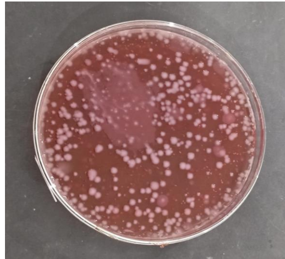
Gambar 1. Koloni Salmonella pada media SSA ( Salmonella Shigella agar )

Hasil pemeriksaan bakteri Salmonella ditemukan kasus 1 dari 20 ekor (5%). Koloni Salmonella pada media SSA ( Salmonella Shigella agar ) (Gambar 1).