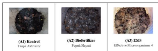
Gambar 2. Kondisi Sampah Organik Ketiga Perlakuan setelah 14 Hari Inkubasi