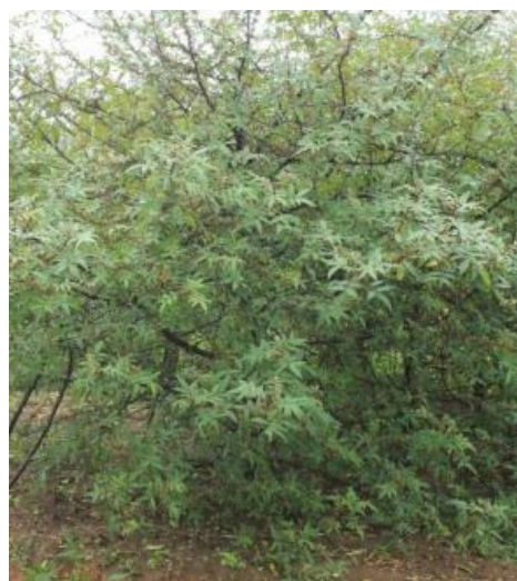
Gambar 1. Tanaman Andaliman (Raja & Hartana, 2017).