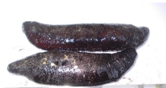
Gambar 2. Holothuria edulis

Ciri-ciri morfologi jenis ini yaitu badan teripang hitam berbentuk bulat panjang. Apabila diangkat dari permukaan air, badannya akan segera mengerut. Di seluruh badannya terdapat bintil-bintil halus. Bagian punggungnya berwarna hitam keungu-unguan atau kebiru-biruan. Sedangkan pada bagian perut, sisi sekitar mulut, dan dubur berwarna kemerah-merahan (Gambar 2).