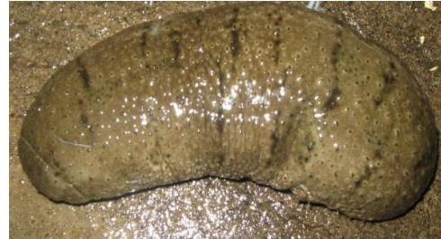
Gambar 1. Holothuria scabra

Ciri-ciri jenis ini, bentuk badan bulat panjang. Di bagian perut umumnya berwarna kuning keputih-putihan. Punggungnya berwarna abu-abu sampai kehitaman, dengan garis-garis melintang berwarna hitam. Seluruh tubuh bila diraba terasa kasar (Gambar 1).