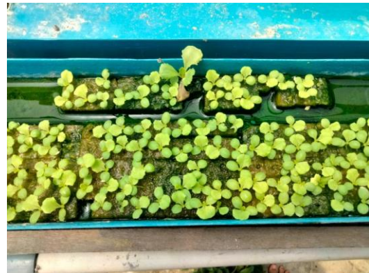
Gambar 2. Tampilan Gambar Selada Minggu Kedua