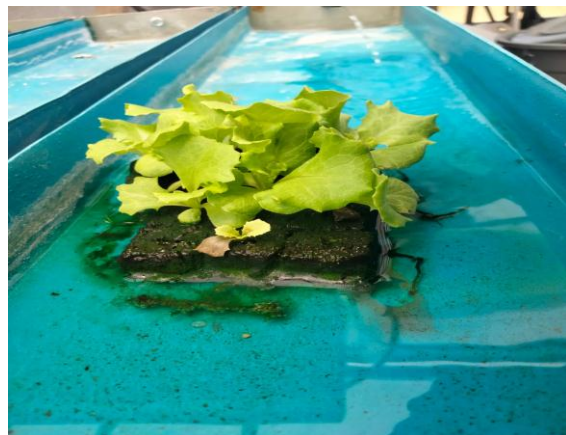
Gambar 3. Tampilan Gambar Selada Minggu Ketiga