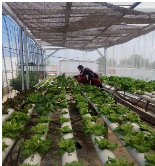
Gambar 4. Tampilan Gambar Selada Minggu Keempat