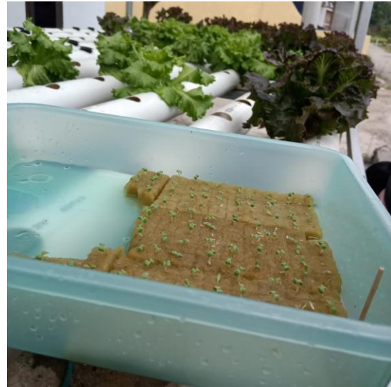
Gambar 1. Tampilan Gambar Selada Minggu Pertama