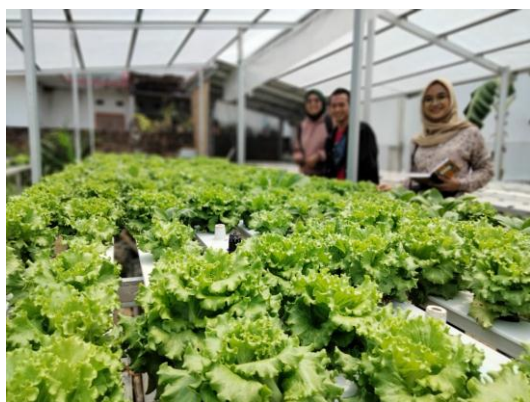
Gambar 5. Tampilan Gambar Selada Minggu Kelima

Temuan penelitian ini bahwa tumbuhan selada melalui proses tanaman hidroponik lebih higienis dan berkembang dengan baik, selain itu tanaman hidroponik dapat mengatasi sempitnya lahan yang dimiliki masyarakat. Namun, perlu ketelitian dan pengawasan lebih dalam agar tetap terjaga kualitas sayuran selada melalui tanaman hidroponik. Temuan penelitian di dukung oleh peneliti sebelumnya bahwa tanaman hidroponik memiliki kualitas yang lebih baik dan lahan yang lebih efektif dan efisien (Warjoto et al., 2020). Ada peneliti sebelumnya membuat rancangan media untuk penyiraman hidroponik (Kusumo & Azis, 2021). Pada penelitian ini masih terbatas pada analisis satu tanaman yaitu selada. Penelitian berikutnya diharapkan untuk menganalisis berbagai tanaman sayur.