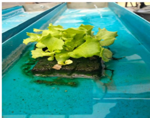
Gambar 3. Tampilan Gambar Selada Minggu Ketiga