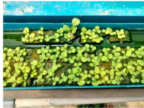
Gambar 2. Tampilan Gambar Selada Minggu Kedua