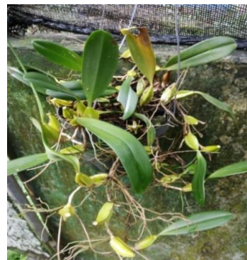
Gambar 8. Bulbophyllum biflorum