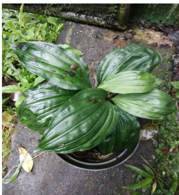
Gambar 11. Calanthe triplicate