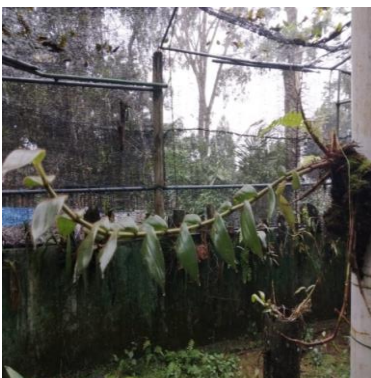
Gambar 12. Trichotosia ferox