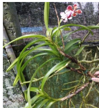
Gambar 7. Vanda limbatta