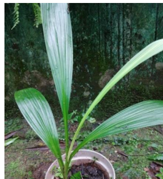
Gambar 15. Spathoglottis sp