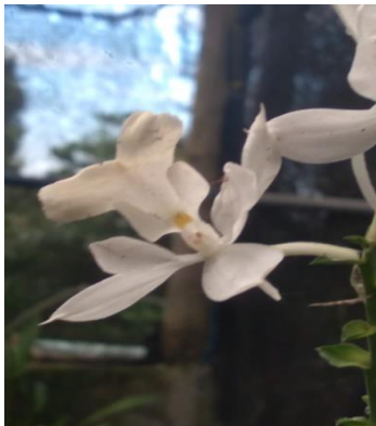
Gambar 3. Calanthe sp