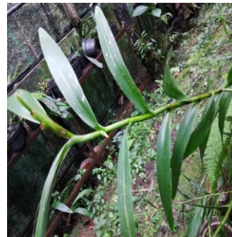
Gambar 14. Arachnis flos-aeris