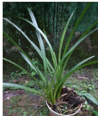
Gambar 6. Cymbidium bicolor