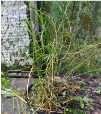
Gambar 9. Arundina graminifolia