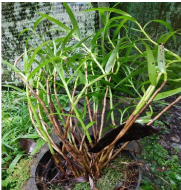
Gambar 10. Appendicula imbricate