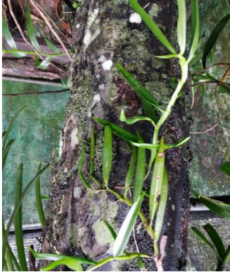
Gambar 17. Trixsperrum subulatum