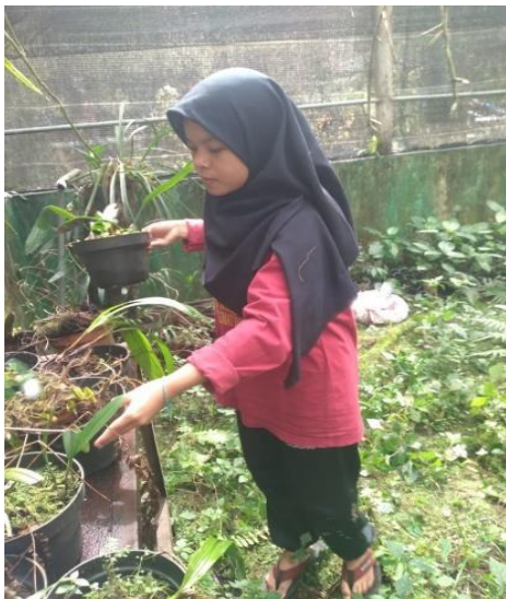
Gambar 19. Saat pembersihan gulma didalam demplot