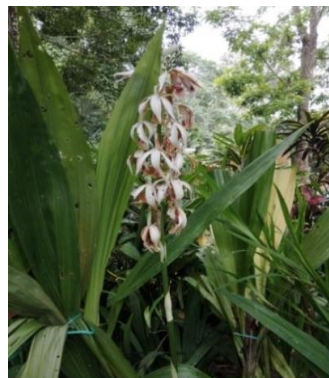
Gambar 16. Phaius thankervillae