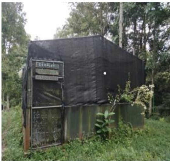
Gambar 18. Demplot anggrek yang berada didalam kawasan Taman Nasional Gunung Rinjani Resort Joben.

Demonstrasi plot merupakan metode penyuluhan pertanian yang dilakukan dengan cara peragaan. Kegiatan demonstrasi dilakukan dengan maksud untuk memperlihatkan suatu inovasi baru kepada sasaran secara nyata atau konkret. Budidaya anggrek dilakukan didalam demplot dengan ukuran L 5 x P 10 X T 2,75 yang berada didalam kawasan sedangkan yang berada di rumah penyelia berukuran L 6 X P 12 x T 3. Bahan atap demplot menggunakan paranet 50% dan rangka demplot menggunakan pipa besi. Demplot diisi dengan rak-rak tempat tanaman anggrek. Rak demplot diisi dengan macam jenis tanaman anggrek baik yang ditanam dalam pot maupun yang ditanam dengan cara ditempel.