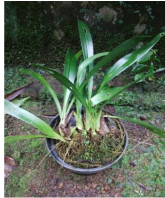
Gambar 13. Eria hyacinthoides