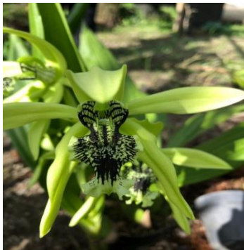
Gambar 2. Coelogyne pandurata Lindl

Jenis angrek yang ditemukan pada Tabel 1, kemudian diidentifikasi secara lengkap dan gambar pada setiap spesies tersaji pada gambar 2-17.