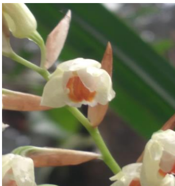
Gambar 4. Pholidota imbricate