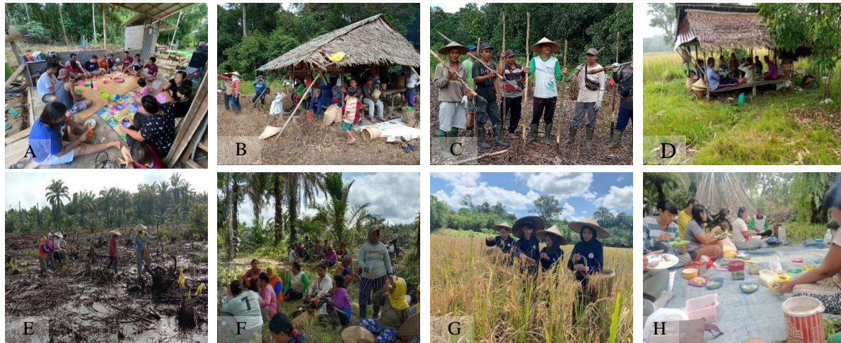
Gambar 2. Kegiatan Pangari yang dilakukan oleh masyarakat suku Dayak Ribun; A. masyarakat sedang berkumpul untuk menentukan waktu dan lokasi kegiatan pangari, B, C, D. Masyarakat sedang mempersiapkan alat dan bahan untuk menanam dan panen padi E. Masyarakat yang sedang menanan padi di ladang, (F) Masyarakat sedang beristiraat sejenak, G, Masyarakat dan mahasiswa sedang memanen padi, I. Masyarakat sedang beristirahat dan mengisi energi