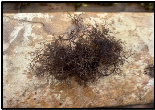
Gambar 5. Hypnea spinella

spinella umumnya menempel pada cangkang kecil dan pecahan karang. Duri tersusun berselang-seling dan berbentuk spiral pendek yang rapat. Holdfast mencakram dan membentuk perlekatan sekunder.