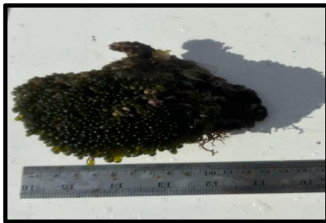
Gambar 2. Boergesenia sp.

Rumput laut jenis B. forbesii memiliki potensi sebagai antipiretik, antioksidan dan juga antikanker dan mengandung antioksidan yang memiliki peran penting dalam pengobatan berbagai penyakit seperti sel kanker dan mencegah proses penuaan dini (Herliany et al. , 2023). Selain mengandung antioksidan menurut (Setiawati & Sari, 2017) bahwa rumput laut B. forbesii juga mengandung vitamin C atau asam askorbat. Vitamin C adalah vitamin yang larut dalam air dan dapat digunakan sebagai terapi untuk melawan infeksi pada sel.