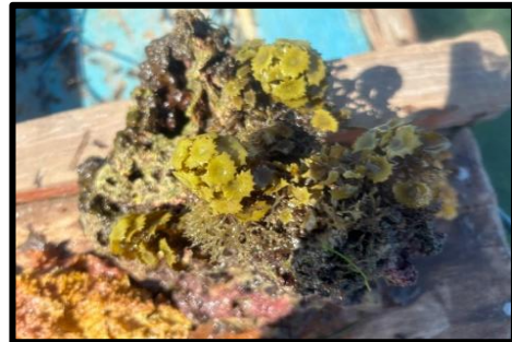
Gambar 3. Turbinaria sp.

dimanfaatkan dalam bidang kesehatan, enzimologi, mikrobiologi, dan ekotoksikologi sebagai antifouling, antifungi, antikoagulan, antitumor, dan antibakteri.