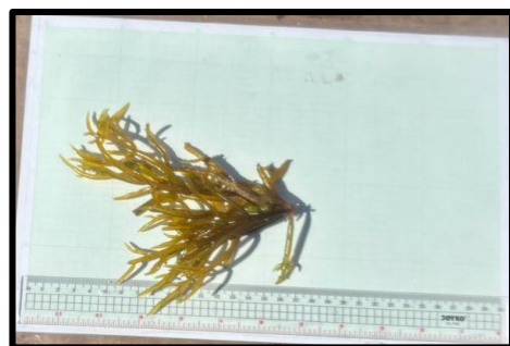
Gambar 4. Gracilaria vermiculophylla

Alga jenis ini memiliki ciri-ciri dengan struktur talus yang licin, berwarna coklat kehijauan atau coklat kekuningan, menempel pada substrat menggunakan akar yang berbentuk cakram kecil, dan bercabang. Umumnya rimbun pada porsi bagian atas rumpun. Rumput laut ini dapat dijumpai di batuan dan terumbu karang. Terdapat beberapa kandungan yang ada pada rumput laut Gracilaria coronopifolia seperti polisakarida, vitamin, dan berbagai senyawa bioaktif, dan juga tanaman ini dapat dimanfaatkan dalam pembuatan pupuk hormonal/biostimulan karena mengandung fitohormon sitokinin yang cukup potensial (Rachman et al. , 2017).