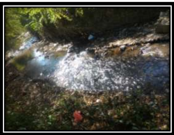
Gambar 3. stasiun II