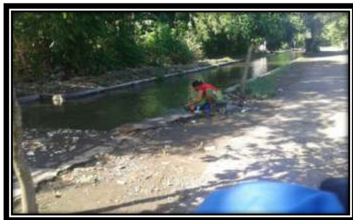
Gambar 4. Stasiun III