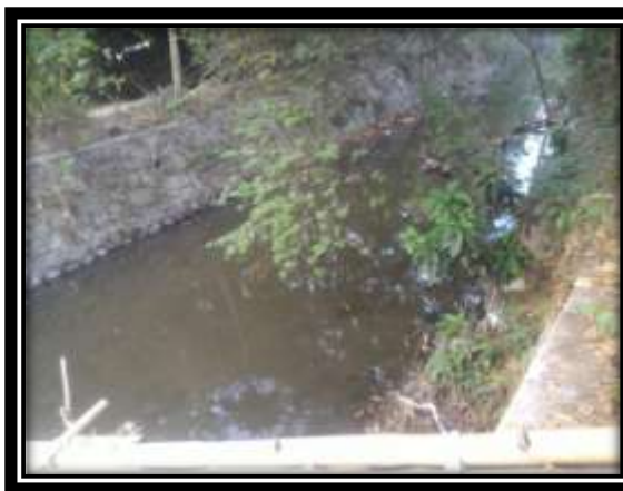
Gambar 2. Stasiun I