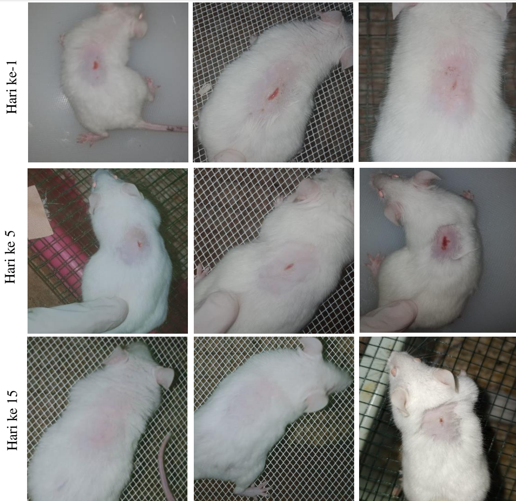
Gambar 1. Gambaran makroskopis luka pada kelompok kontrol dan perlakuan