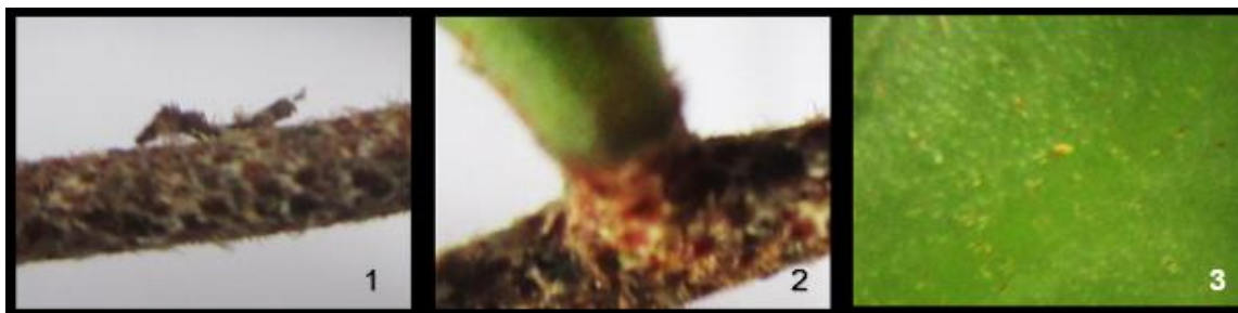
Gambar 1-3. Morfologi P. heterophylla . 1. Rhizome, 2. ptiolus dan 3. permukaan atas lamina steril.

Rhizom panjang menjalar, coklat tua, diameter sekitar 1.5 mm, berisik rapat. Ental steril : ptiolus coklat tua, panjang sekitar 2 mm, diameter 3 mm, bertrikoma; lamina tunggal, oblong, ukuran \pm 2.5 \times 0.8 . Ental fertil : linear, ujung menyempit, bentuk garis, ukuran \pm 5 \times 5 . Sori berbentuk garis.