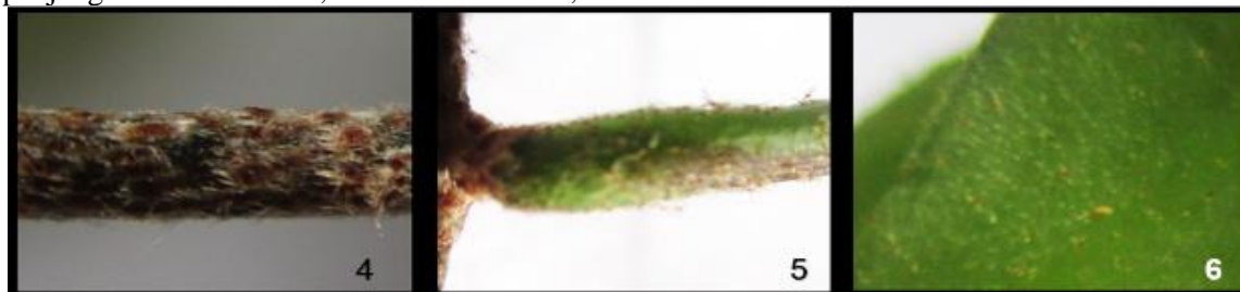
Gambar 4-6. Morfologi P. lanceolata . 4. Rhizome, 5. ptiolus dan 6. permukaan atas lamina steril.

bertrikoma; lamina tunggal, lanset, ukuran \pm 10 \times 1.8 cm. Ental fertil : ptiolus coklat kehitaman, lamina oblong, Ujung menyempit, ujung menyempit, bentuk garis, ukuran \pm 15 \times 1.5 cm. Sori bulat.