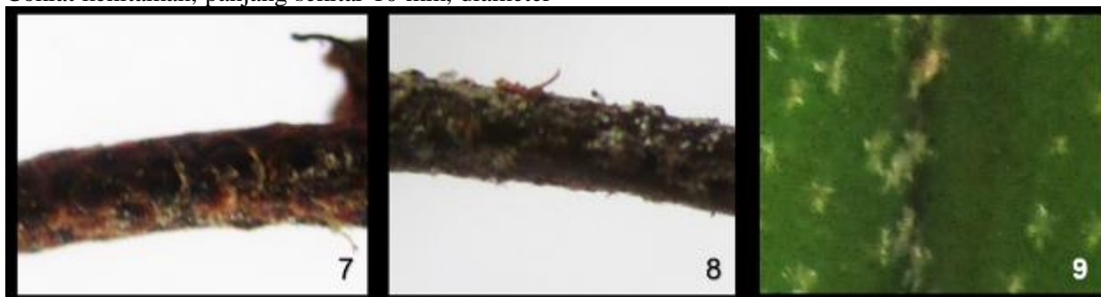
Gambar 7-9. Morfologi P. longifolia . 7. Rhizom, 8. pteiolus dan 9. permukaan atas lamina steril.

4 mm, bertrikoma; lamina tunggal, lanset, ukuran ± 10x1.8 cm. Ental fertil : Oblong, ujung menyempit, ujung menyempit, bentuk linear, ukuran ± 15x1.5 cm. Sori berbentuk bulat.