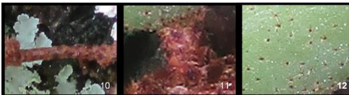
Gambar 10-12. Morfologi P. heterophylla . 10. Rhizom, 11. pteiolus dan 12. permukaan atas lamina steril.

bertrikoma; lamina tunggal, membulat - oval, ukuran ± 2.0x1.5 cm. Ental fertil : ptiolus coklat, panjang sekitar 10 mm, diameter ± 0.5 mm, bertrikoma; lamina tunggal, linear, ukuran ± 10x0.7 cm.. Sori berbentuk garis.