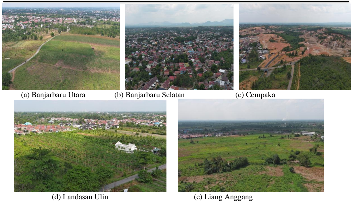
Gambar 2. Hasil foto dokumentasi drone