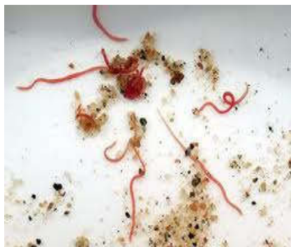
Gambar 1. Hasil pengambilan sampel spesies Tubifex tubifex

Stasiun III mempunyai perbedaan yang sangat signifikan jika dibandingkan dengan stasiun I dan II, yaitu mulai dari jenis substrat dasar, pH, suhu dan kedalaman yang berbeda sehingga menyebabkan sedikitnya jumlah spesies yang ditemukan. Hal ini didukung oleh Khairuman, dkk. (2010), menyatakan bahwa cacing Tubifex tubifex menyukai dasar perairan yang banyak mengandung bahan-bahan organik terlarut merupakan habitat kesukaannya.