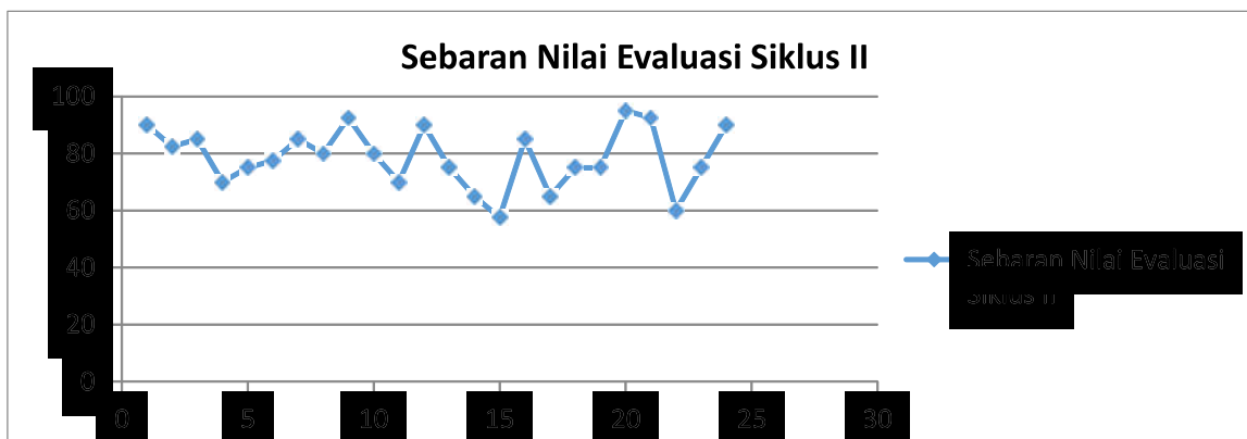
Gambar 4.2. Sebaran Nilai Mahasiswa Hasil Evaluasi Siklus II

Adapun sebaran nilai hasil evaluasi dan statistik hasil belajar mahasiswa pada siklus 2 secara berturut-turut diberikan oleh Gambar 4.2 dan Tabel 4.4 di bawah ini.