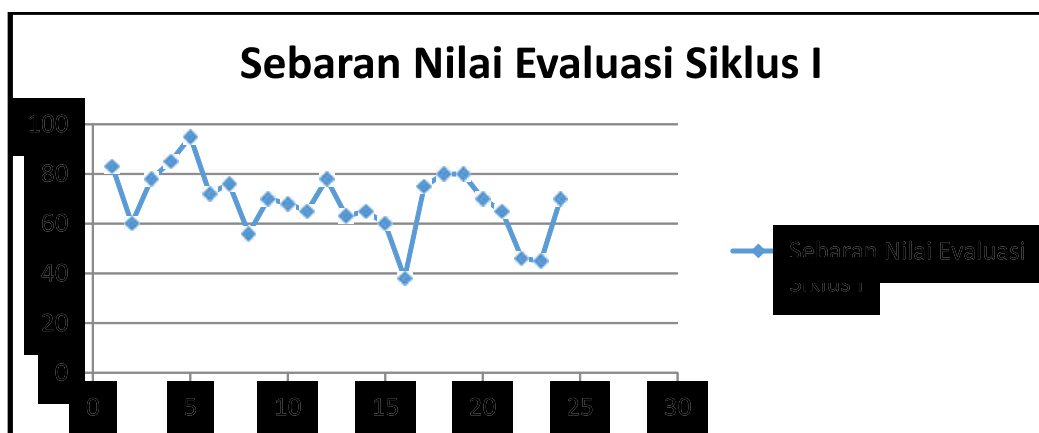
Gambar 4.1. Sebaran Nilai Mahasiswa Hasil Evaluasi Siklus 1

Adapun sebaran nilai hasil evaluasi dan statistik hasil belajar mahasiswa pada siklus 1 secara berturut-turut diberikan oleh Gambar 4.1 dan Tabel 4.2 di bawah ini.