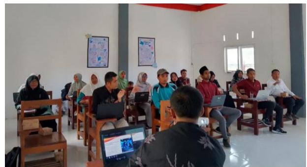
Gambar 2. Sesi Penjelasan terkait AI

serius mengikuti materi, berdiskusi, serta mencoba langsung aplikasi-aplikasi berbasis AI. Ada tiga AI utama yang diberikan saat pelatihan yaitu ChatGPT, Gamma, dan Canva. Serta diberikan penjelasan dasar terkait beberapa AI lain seperti Deepsek, Gemini, Wizer.me.