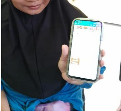
Gambar 5. Hasil desain worksheet

sederhana seperti mencocokkan gambar, menebalkan huruf, serta mengenal kosakata dasar. Worksheet dirancang untuk mendorong pembelajaran mandiri di rumah dan memperkuat interaksi anak dengan orang tua.