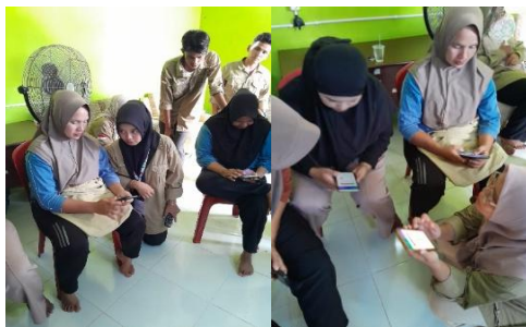
Gambar 2. Peserta unduh aplikasi

Peserta pelatihan juga dibantu oleh rekan mahasiswa saat kegiatan unduh aplikasi canva agar peserta merasa jelas tahapan unduh secara langsung. Peserta juga saling diskusi antar peserta untuk melihat proses unduh aplikasi agar sesuai dengan arahan. Peserta dibantu oleh mahasiswa sebagai pendamping kegiatan dalam proses unduh aplikasi untuk mendapat kejelasan jenis-jenis fitur.