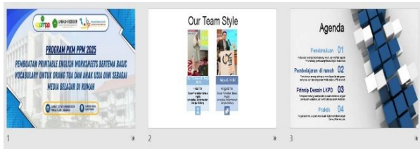
Gambar 1. Materi Presentasi