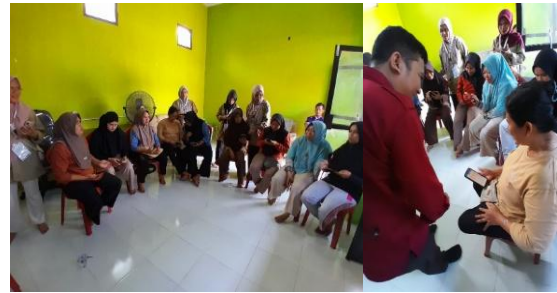
Gambar 3. Pemilihan Tema Latihan

sesuai dengan topik Kosakata Bahasa Inggris dasar untuk anak usia dini.