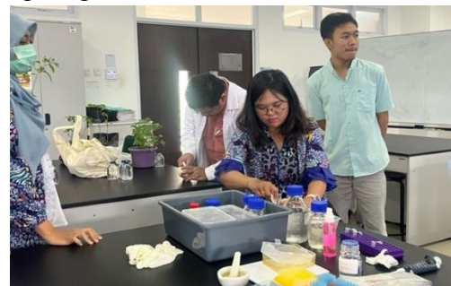
Gambar 4. Persiapan alat dan bahan untuk pelatihan teknik biologi molekuler di Laboratorium Mikrobiologi Universitas Tidar

Persiapan yang selanjutnya adalah persiapan alat dan bahan yang akan digunakan untuk pelatihan teknik biologi molekuler. Persiapan alat dan bahan termasuk kalibrasi alat yang akan digunakan, pengecekan bahan reagen dan kit, serta tata layout laboratorium. Seluruh tahapan persiapan dilakukan dengan memperhatikan prosedur biosafety laboratorium mikrobiologi, termasuk penggunaan APD seperti jas laboratorium, sarung tangan, dan masker.