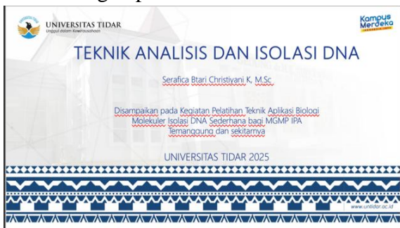
Gambar 5. Materi Pelatihan Isolasi DNA Sederhana bagi MGMP IPA Temanggung

Pembuatan materi diperlukan untuk meningkatkan pemahaman guru biologi MGMP IPA Temanggung untuk menyegarkan kembali pengetahuan tentang biologi molekuler dan aplikasinya. Materi yang dibuat adalah teknik isolasi DNA sederhana yang berisi tentang latar belakang isolasi DNA, tujuan isolasi DNA, dan manfaat serta aplikasi yang dapat dikembangkan dalam pembelajaran IPA di SMP dengan pendekatan STEM.