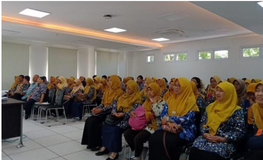
Gambar 8. Kegiatan evaluasi pelaksanaan kegiatan setelah pelatihan

Pada kegiatan evaluasi ini, dilakukan sesi pemaparan hasil pelatihan oleh peserta kegiatan yaitu guru MGMP IPA Temanggung sebagai mitra pengabdian. Guru-guru MGMP menyambut baik kegiatan ini dan menilai bahwa pelatihan isolasi DNA merupakan bentuk pembelajaran rutin yang sangat dibutuhkan untuk meningkatkan kapasitas profesional mereka.