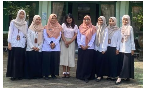
Gambar 3. Koordinasi dengan Perwakilan MGMP Guru Biologi Kota Magelang

penerapannya dalam pembelajaran IPA. Selain itu, tim pengabdian dan mitra memutuskan jadwal pelaksanaan kegiatan pengabdian kepada masyarakat tentang pelatihan teknik biologi molekuler terutama teknik isolasi DNA sederhana yang akan dilakukan di Laboratorium Mikrobiologi Universitas Tidar bekerjasama dengan Laboratorium Biologi Molekuler UNS.