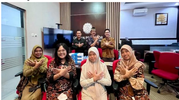
Gambar 2. Koordinasi dan FGD dengan Laboratorium Biologi Molekuler UNS

Pada tahap ini dilakukan koordinasi dengan mitra pengabdian yaitu Laboratorium Biologi Molekuler UNS dan mitra guru MGMP berkaitan dengan kebutuhan mitra tentang pemahaman teknik biologi molekuler. Tim pengabdian berkerjasama dengan mitra Laboratorium Biologi Molekuler UNS selaku calon narasumber yang berkolaborasi dengan narasumber dari tim pengabdian untuk kegiatan pelatihan aplikasi teknik biologi molekuler. Tim pengabdian juga berkoordinasi dengan MGMP IPA Temanggung untuk memperoleh persetujuan kegiatan dalam rangka meningkatkan pemahaman guru biologi terhadap teknik biologi molekuler.