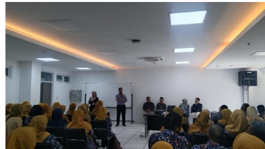
Gambar 6. Penyampaian materi pelatihan teknik biologi molekuler tentang isolasi DNA sederhana

dilaksanakan pada Kamis, 2 Oktober 2025. Sesi pertama adalah paparan materi isolasi DNA dan prosedur pelaksanaannya, sedangkan sesi kedua adalah praktik isolasi DNA sederhana dari tumbuhan. Adapun narasumber sesi pertama adalah tim pengabdian dan Laboratorium Biologi Molekuler UNS sedangkan pada sesi kedua fasilitator adalah tim pengabdian yang melibatkan seluruh anggota pengabdian.