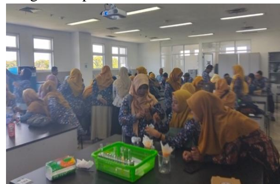
Gambar 7. Kegiatan praktik pelatihan teknik biologi molekuler isolasi DNA pada tumbuhan di Laboratorium Mikrobiologi Universitas Tidar

Pada sesi praktik pelatihan isolasi DNA sederhana, peserta dibagi menjadi dua kelompok besar agar dapat melakukan praktik isolasi DNA sederhana dengan nyaman di laboratorium. Kegiatan diawali dengan sesi demonstrasi teknik isolasi DNA oleh narasumber dan dilanjutkan dengan praktik isolasi DNA tumbuhan menggunakan sayuran dan buah-buahan yang telah dipersiapkan. Seluruh peserta terlihat antusias dengan setiap peserta terlibat aktif mencoba langsung teknik isolasi DNA secara partisipatif pada masing-masing kelompok.