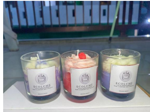
Gambar 2. Produk

Secara keseluruhan, peningkatan jumlah peserta yang memahami materi, hal ini menunjukkan bahwa kegiatan sosialisasi dan praktik pembuatan lilin aromaterapi dari minyak jelantah telah berjalan dengan efektif. Evaluasi pemahaman peserta menjadi indikator penting dalam menilai keberhasilan kegiatan pengabdian kepada masyarakat yang berorientasi pada peningkatan pengetahuan, kesadaran lingkungan, serta pemberdayaan ekonomi berbasis rumah tangga.