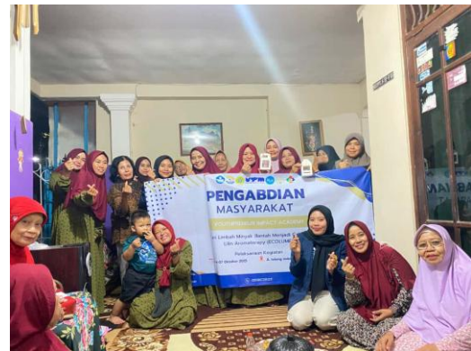
Gambar 4. Foto bersama