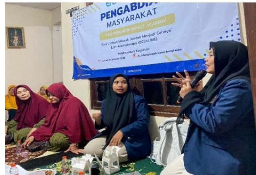
Gambar 3. Sesi diskusi