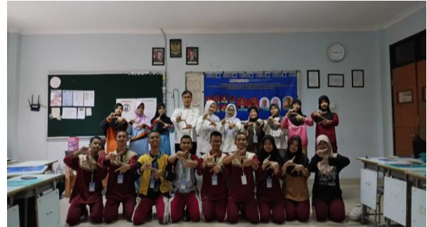
Gambar 1. Pelatihan pertama konsep dasar kesantunan

percakapan digital. Pelatihan pertama kemudian memaparkan konsep dasar kesantunan melalui diskusi dan analisis dialog, sehingga siswa memahami bahwa kesantunan tidak hanya ditentukan oleh pilihan kata, tetapi juga oleh konteks, relasi sosial, dan dampak tuturan.