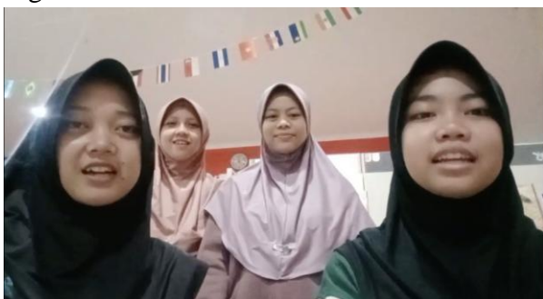
Gambar 3. Video Kampanye

Efektivitas program dinilai melalui hasil tes, pengamatan proses, dan kualitas proyek siswa. Kesadaran siswa meningkat signifikan setelah mengikuti pelatihan; mereka mampu mengidentifikasi pelanggaran kesantunan dan memberikan alternatif kalimat yang lebih sopan. Sikap berbahasa mereka berubah menjadi lebih terkendali, baik dalam percakapan langsung maupun digital. Praktik kesantunan juga terlihat dalam interaksi nyata selama pendampingan, termasuk peningkatan kemampuan mereka dalam memilih diksi, memberi kritik, dan menghindari komentar negatif di media sosial.