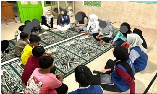
Gambar 1. Diskusi reflektif tentang bullying

Diskusi reflektif memperlihatkan perubahan cara pandang peserta terhadap praktik perundungan. Anak-anak mulai memahami bahwa intensitas, pengulangan, dan dampak emosional merupakan indikator penting dalam membedakan candaan dan bullying . Temuan ini menunjukkan bahwa literasi sosial tidak cukup dibangun melalui definisi normatif, tetapi memerlukan proses refleksi berbasis pengalaman sosial nyata.