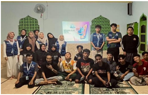
Gambar 4. Pemaparan menjaga jejak digital