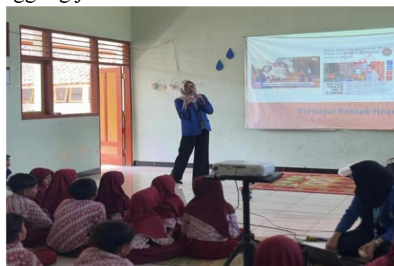
Gambar 3. Pemaparan etika bermedia sosial

Pembahasan etika bermedia sosial yang dikaitkan dengan contoh kasus nyata dan pengenalan regulasi (UU ITE dan UU PDP) membantu peserta memahami bahwa ruang digital memiliki aturan sosial dan hukum yang setara dengan ruang luring. Hal ini memperkuat literasi digital peserta, tidak hanya pada aspek teknis, tetapi juga pada dimensi etis dan tanggung jawab sosial.