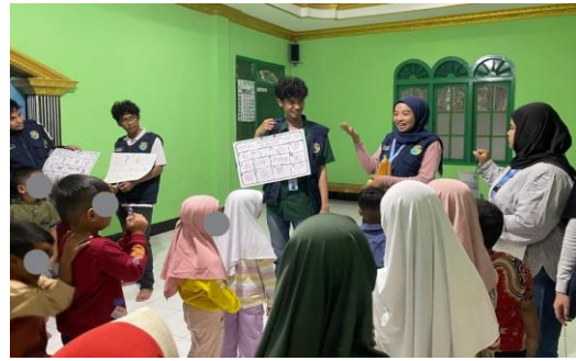
Gambar 2. Tanya jawab dan simulasi kasus

diarahkan pada penguatan kesadaran sosial, bukan sekadar penyampaian larangan perilaku.