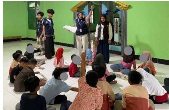
Gambar 6. Pembuatan slogan dan video

pengetahuan abstrak, melainkan sebagai praktik sosial yang dialami dan dihasilkan bersama. Pendekatan ini memperkuat keterlibatan emosional peserta dan berpotensi menghasilkan dampak jangka panjang dibandingkan kegiatan edukasi yang bersifat seremonial.