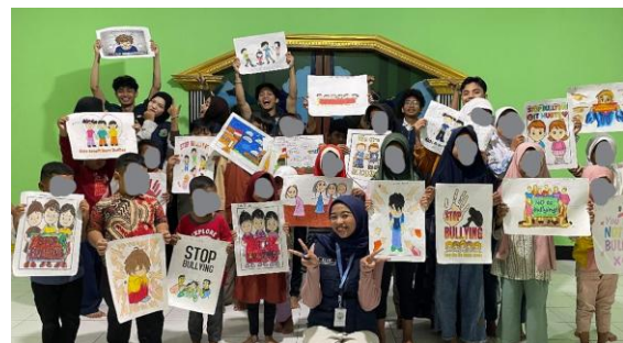
Gambar 7. Mewarnai poster