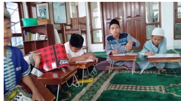
Gambar 1. Suasana belajar

cerita pendek akan lebih mudah diingat dan dapat bertahan lebih lama dalam ingatan siswa – sebagaimana kita memahami bahwa ingatan sangat penting dalam pembelajaran bahasa (Aprilia & Aminatun, 2022) – karena Proses tersebut diperoleh dengan melibatkan berbagai indera (mata untuk membaca dialog, telinga untuk mendengar intonasi dan artikulasi dialog, serta kulit ketika tangan menulis dialog di buku catatannya) (Benoit et al., 2000).