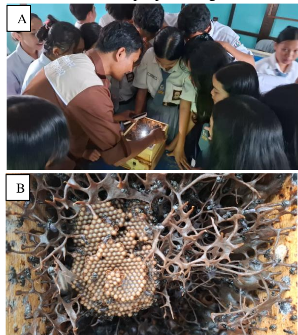
Gambar 3. Demonstrasi kotak budidaya kelulut, A) Siswa melihat langsung bentuk sarang kelulut, B) struktur sarang kelulut yang bisa diamati didalam kotak edukasi budidaya kelulut. Terlihat lebah pekerja, telur, propolis dan kantong madu.

Evaluasi kegiatan menunjukkan tanggapan yang sangat positif dari siswa. Berdasarkan hasil evaluasi, 55 persen siswa menyatakan sangat menyukai kegiatan ini, dan 45 persen lainnya menyatakan menyukai kegiatan ini. Ketika diberi pertanyaan apakah kegiatan seperti ini perlu diadakan kembali di sekolah, seluruh siswa (100%) menjawab setuju bahwa kegiatan semacam ini sangat bermanfaat dan perlu dilakukan lagi di masa mendatang. Dari sisi pemahaman materi, 60 persen siswa menyatakan materi mudah dipahami, dan 40 persen lainnya menyatakan cukup mudah dipahami. Hasil evaluasi ini menunjukkan bahwa kegiatan pengabdian masyarakat yang dilakukan telah memberikan manfaat nyata dan memberikan peningkatan pengetahuan yang signifikan sebagaimana direncanakan dalam proposal kegiatan.