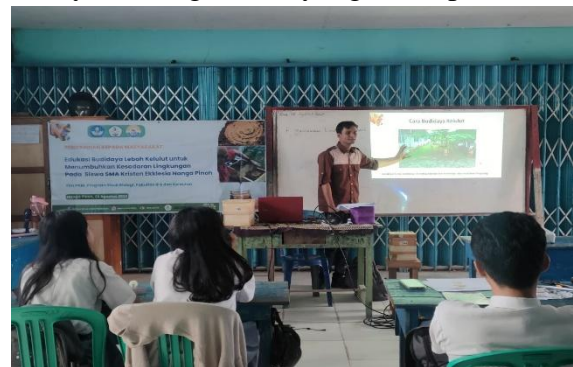
Gambar 2. Penyampaian materi menggunakan Power Point dan media pemutaran video

proses pemindahan sarang kelulut ke dalam kotak budidaya, sehingga siswa dapat melihat secara lebih jelas bagaimana praktik budidaya kelulut dilakukan. Selama pemaparan materi berlangsung, siswa sangat antusias memperhatikan setiap penjelasan dan visual yang ditampilkan (Gambar 2). Pemateri juga melakukan interaksi dengan siswa untuk memastikan bahwa penjelasan dapat diterima dengan baik dan untuk meningkatkan ketertarikan siswa terhadap materi yang sedang diberikan. Selain itu, pemateri memberikan kesempatan kepada siswa untuk bertanya agar dapat mengetahui sejauh mana pemahaman dan rasa ingin tahu siswa terhadap biologi, dan budidaya kelulut serta peranannya dalam menjaga lingkungan sekitar. Siswa sangat antusias mengikuti pemaparan materi yang dilihat dari banyaknya siswa yang bertanya tentang materi yang disampaikan.