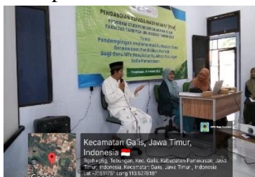
Gambar 1. Pengantar oleh ketua yayasan

awal kegiatan diawali dengan penyampaian pengantar oleh ketua yayasan tentang bagaimana keberlangsungan pembelajaran di Mts Nasyiatu Syubban kemudian dilanjutkan pada penyampaian materi konseptual mengenai kurikulum cinta dan pendidikan profetik. Materi disampaikan secara dialogis dengan menekankan pada pemahaman nilai, prinsip, serta relevansinya dalam konteks pembelajaran madrasah. Penyampaian materi tidak diarahkan pada petunjuk teknis penerapan di kelas, melainkan pada penguatan kerangka berpikir dan orientasi pedagogik guru sebagai bentuk implementasi awal kurikulum pada level kesadaran dan pemaknaan.