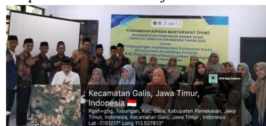
Gambar 4. Foto bersama pasca kegiatan

Data kegiatan diperoleh melalui pengamatan partisipatif selama proses pendampingan, pencatatan refleksi yang muncul dalam diskusi, serta respons lisan guru terhadap materi dan dialog yang berlangsung. Data tersebut dianalisis secara deskriptif-kualitatif dengan menekankan pada pola pemahaman, respons, dan refleksi pedagogik guru. Mengingat sifat kegiatan yang bersifat konseptual dan reflektif, hasil pengabdian ini tidak diklaim sebagai peningkatan keterampilan teknis atau perubahan praktik pembelajaran secara langsung, melainkan sebagai fondasi awal implementasi kurikulum cinta berwawasan pendidikan profetik, yang memerlukan pendampingan lanjutan secara lebih aplikatif dan berkelanjutan.