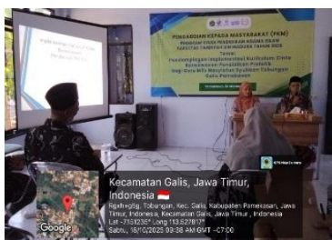
Gambar 2. Penyampaian materi PkM

Tahap selanjutnya berupa eksplorasi pengalaman pedagogik guru. Dalam kesempatan ini para guru diajak untuk berbagi pengalaman pembelajaran yang selama ini dijalankan, termasuk cara mereka memaknai relasi dengan peserta didik serta nilai-nilai yang hadir dalam praktik pembelajaran sehari-hari. Proses ini berfungsi sebagai jembatan antara kerangka konseptual yang telah disampaikan dengan realitas praktik pembelajaran di kelas. Kegiatan kemudian dilanjutkan dengan diskusi reflektif sebagai ruang dialog dan umpan balik bersama, di mana guru dan tim pengabdian