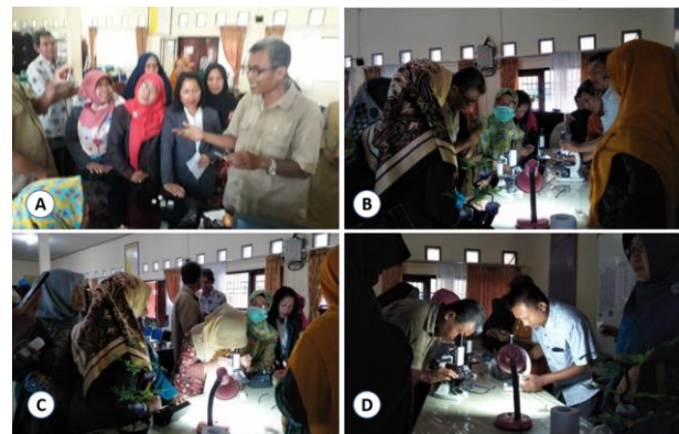
Gambar 1. Kegiatan pelatihan pembuatan preparat squash ujung akar. A. Dosen memberikan penjelasan metode squash . B. Pendampingan praktek pengamatan kromosom. C. Guru mitra melakukan pengamatan sel-sel yang bermitosis. D. Dosen memeriksa preparat hasil praktek guru biologi mitra peserta pelatihan.

Kegiatan pelatihan praktek pembuatan preparat squash ujung akar untuk pengamatan kromosom merupakan bekal pengalaman sangat berharga yang diperoleh guru biologi untuk meningkatkan keterampilan dan pengetahuan dalam mengemban tugas membimbing praktikum sel dan genetika di sekolah.