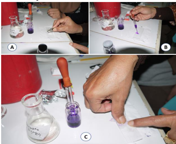
Gambar 2. Pembuatan preparat mitosis dengan metode squash . A. Pencuplikan ujung akar yang diwarnai carbolic fuchsin. B. Cuplikan ujung akar ditetesi carbolic fuchsin. C. Proses Squash ujung akar

Untuk kepentingan dokumentasi dan analisis data lebih lanjut perlu dilakukan pengambilan gambar kromosom. Teknik pengambilan gambar kromosom pada mikroskop yang dilengkapi kamera digital dapat dilakukan dengan mudah, namun mikroskop dengan spesifikasi demikian tidak tersedia pada pelatihan ini. Oleh karena itu pengambilan gambar dilakukan secara sederhana menggunakan kamera Digital SLR atau kamera Hp ( Handphone ). Guru biologi dibimbing melakukan pengambilan gambar kromosom melalui lensa okuler mikroskop cahaya. Pemotretan dilakukan apabila bidang pandang dibawah mikroskop tampak penuh pada layar kamera. Latihan pemotretan berulang-ulang yang dilakukan guru biologi dengan berpedoman pada petunjuk praktikum meningkatkan keterampilan mereka dalam pengambilan gambar kromosom dibawah mikroskop.