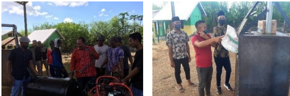
Gambar 5. Kegiatan Pelatihan Operasional dan Perawatan APSTA

masih dalam masa new normal. Pelatihan tetap dilaksanakan secara tatap muka karena status desa Batu Bangka nol positif covid.