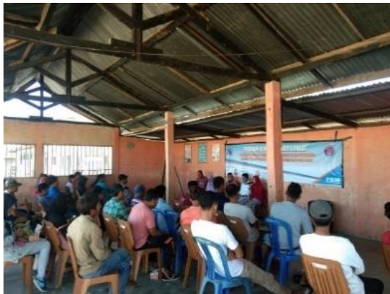
Gambar 5. Kegiatan Penyuluhan

Kegiatan penyuluhan bertujuan untuk memberikan edukasi dan meningkatkan kesadaran peserta tentang praktek penanganan sampah yang masih salah di masyarakat dan dampak dari penanganan sampah yang tidak ramah terhadap lingkungan. Pada kegiatan tersebut juga diperkenalkan teknologi pengolahan sampah yang dapat mengatasi permasalahan sampah khususnya di perairan Prajak.