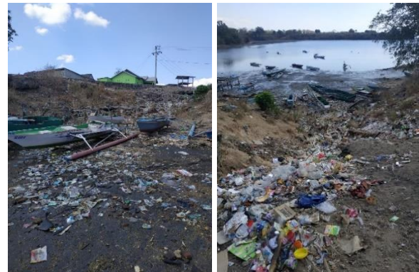
Gambar 2. Kondisi Kumuh Dusun Prajak yang Dipenuhi Sampah

(Permana & Iqbal, 2018). Kondisi pesisir Prajak memperlihatkan kondisi kumuh dan penuh sampah terutama di sekitar dermaga yang merupakan jalan masuk menuju obyek wisata dusun Prajak.