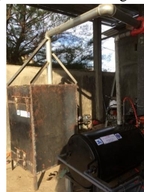
Gambar 4. Alat Pembakar Sampah Tanpa Asap (APSTA)

APSTA yang diberikan kepada mitra sejumlah 1 unit dengan bentuk alat sebagai berikut: