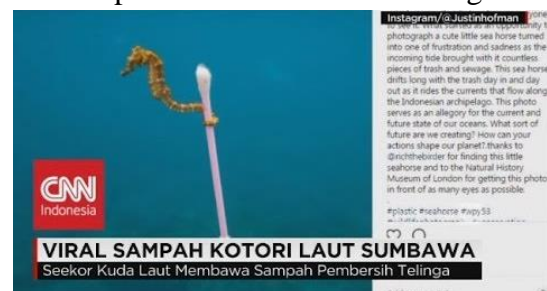
Gambar 1. Berita tentang Sampah yang Mengotori Laut Sumbawa

dikarenakan banyaknya sampah yang masuk ke laut. Menurut (Lamb, 2018) bahwa terdapat keterkaitan antara sampah plastik dengan kesehatan perairan dan terumbu karang.