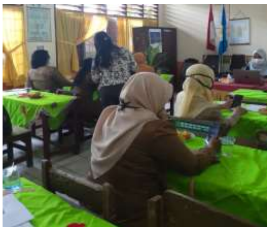
Gambar 1. Suasana saat guru-guru menginstal Zoom pada smartphone

Berikut ini Suasana saat kegiatan pelatihan: