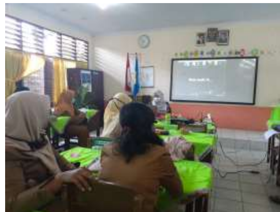
Gambar 2. Suasana saat guru-guru bergabung ke dalam Room Meeting