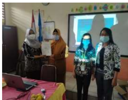
Gambar 3. Suasana saat memberikan ucapan tanda terima kasih berupa sertifikat ke pada kepala sekolah dan guru