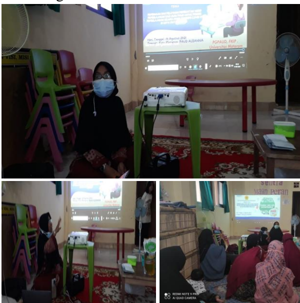
Gambar 1. Kegiatan Pengabdian pada masyarakat secara offline (Pertemuan langsung)

1. Dokumentasi pada saat kegiatan pelatihan editing video secara offline.