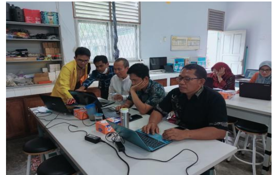
Gambar 3. Para peserta dibimbing oleh Tim Peneliti

banyak informasi terkait pemanasan global dan perubahan iklim yang dilakukan peserta guru MGMP di bawah bimbingan tim pengabdian. Kegiatan ini dilaksanakan di Program Studi Pendidikan Fisika kampus Unsri Indralaya;