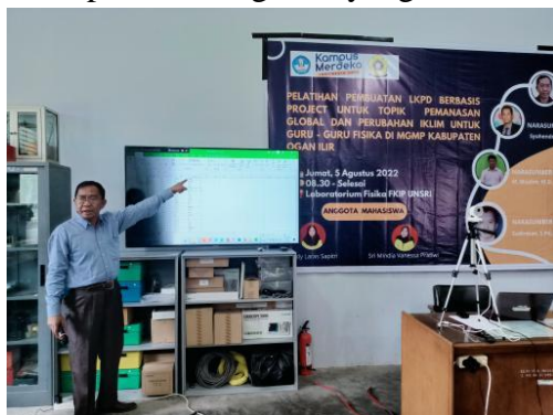
Gambar 2. Penyampaian materi terkait informasi dan data pemanasan global