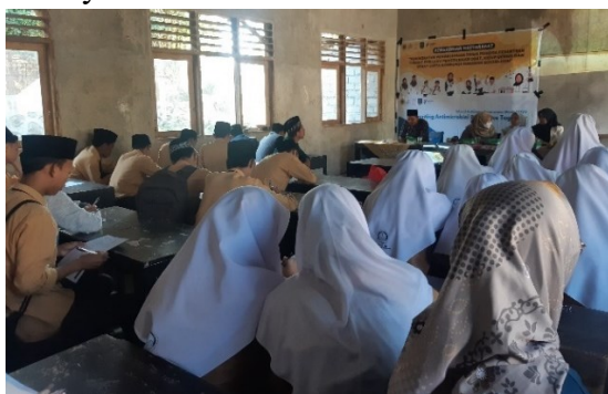
Gambar 1. Kegiatan Pengisian Kuesioner Anemia

Penyuluhan dimulai pada pukul 09.00 WITA dengan mengisi pretest tentang anemia yang berlangsung selama 15 menit. Kuesioner diberikan sebelum penyampaian materi untuk mengetahui pengetahuan awal siswa SMA Islam Syarif Imamuzzahidin terkait anemia.