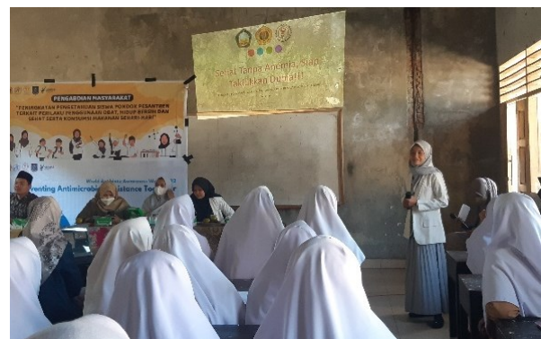
Gambar 3. Kegiatan Penyuluhan Anemia

Semua responden diberikan pretest dan posttest dengan 18 pertanyaan sama yang sudah divalidasi oleh para ahli dengan nilai rata-rata I-CVI sebesar 0,96. Pemberian pretest dan posttest dilakukan untuk melihat perbandingan pengetahuan siswa tentang anemia. Persentase hasil skor responden SMA Islam Syarif Imamuzzahidin dapat dilihat pada Tabel 1.