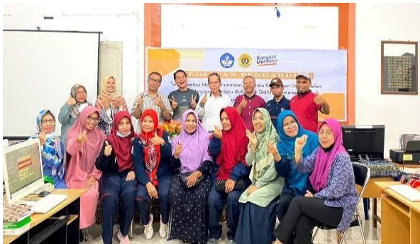
Gambar 4. Kegiatan akhir

Pada tahapan kegiatan ini seluruh rangkaian kegiatan yang telah dilakukan dievaluasi secara bersama-sama oleh tim pengabdian. Kegiatan evaluasi dimaksudkan untuk mengetahui sejauh mana sosialisasi ini membantu guru dalam memaknai dan menerapkan model penanaman nilai kesetaraan gender pada setiap proses belajar mengajar. Evaluasi dilakukan dengan cara mewawancarai guru peserta yang mengikuti proses kegiatan pengabdian sosialisasi. Wawancara ini diharapkan mampu mendeskripsikan bagaimana guru telah menerapkan nilai kesetaraan gender tersebut pada proses pembelajaran di dalam kelas.