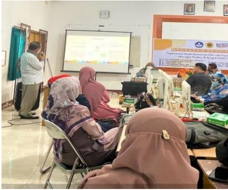
Gambar 2. Pemaparan materi sosialisasi