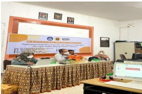
Gambar 3. Dialog dan Diskusi