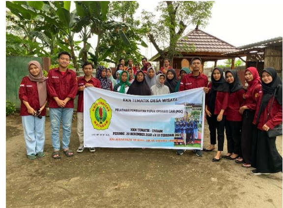
Gambar 6. Pelatihan Pembuatan POC

Alhasil, pelaksanaan kegiatan yang rencananya pada minggu ke-3 pengabdian diundur menjadi minggu ke-5. Namun kegiatan ini dikatakan berhasil dengan melihat antusias dan perkembangan masyarakat Desa Kuranji Dalang yang berada di Dusun Kuranji Bangsal yang dapat menerapkan langsung cara membuat Pupuk Organik Cair (POC), dari proses persiapan hingga pengemasan produk.