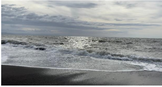
Gambar 2. Wisata Pantai 2023

Berdasarkan hasil observasi tim KKN Tematik Universitas Mataram tahun 2023, ditemukan beberapa permasalahan warga yang bersifat mayor dan merugikan untuk wilayah wisata apabila tidak ditangani secara cepat. Permasalahan tersebut mengenai sampah yang berserakan di daerah tersebut, baik sampah organik maupun sampah non-organik yang bersumber dari berbagai sudut. Sampah-sampah tersebut ditemukan di daerah pesisir hingga daerah irigasi yang berada di dekat pusat konservasi penyu. Setelah melakukan mini riset di daerah tersebut, masyarakat setempat menyatakan bahwa sumber sampah berasal dari sampah rumah tangga sehari-hari yang dibuang setiap sore ke daerah pantai. Permasalahan-permasalahan tersebut mengindikasikan kurangnya kesadaran masyarakat sekitar dalam menjalankan tanggung jawab dalam memajukan potensi wisata desa sendiri. Selain itu, dokumentasi mengenai keunikan desa wisata Kuranji masih minor sehingga berdasarkan mini riset yang telah dilakukan rata-rata pengunjung berasal dari satu Kabupaten, yaitu Lombok Barat.