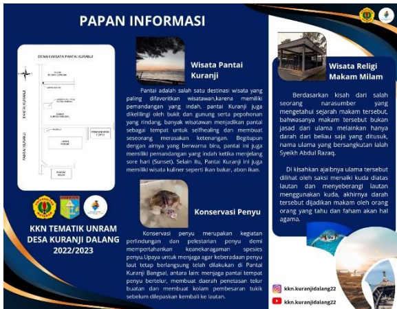
Gambar 4. Peta Informasi Desa Wisata