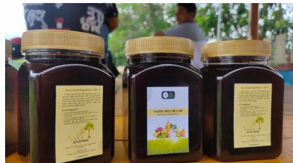
Gambar 7. Produk Hasil Pelatihan Pembuatan POC