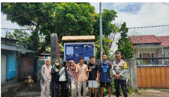
Gambar 5. Pemasangan Peta Informasi Desa Wisata dengan Babinsa Desa Kuranji Dalang, Lombok Barat.