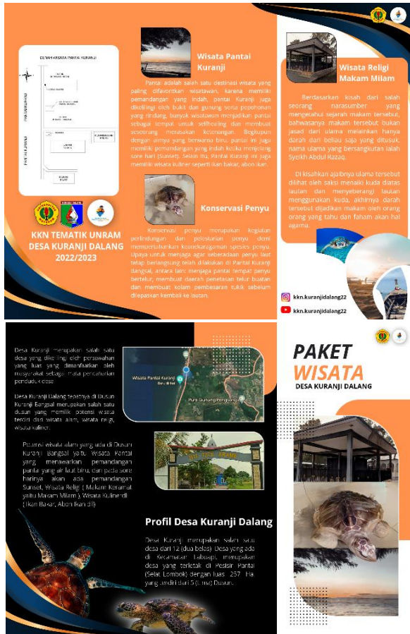
Gambar 8. Leaflet/ Selebaran Informasi Paket Wisata Desa Kranji Dalang

Pelaksanaan program kerja KKN Tematik Universitas Mataram di Desa Kuranji Dalang dapat dikatakan berhasil dan sesuai dengan proposal sebelumnya yang telah diajukan dengan mempertibangkan dan menyesuaikan kondisi real yang terjadi di lapangan. Pembuatan peta wisata Desa Kuranji Dalang, pembuatan video dokumenter mengenai keunikan daerah wisata, serta pelatihan pembuatan POC telah terselesaikan dengan baik. Dengan adanya program KKN-T Universitas Mataram Periode Desember 2022-Februari 2023 di Desa Kuranji Dalang, diharapkan sektor pariwisata sebagai salah satu penunjang pariwisata dapat tumbuh dengan baik dan sumber daya manusia yang ada semakin berkembang.