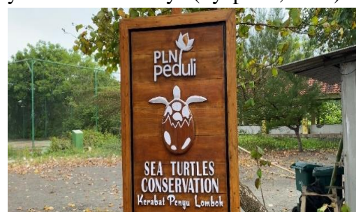
Gambar 1. Wilayah Konservasi Penyu 2023

objek utama di Desa ini (Budianto, 2020). Seiring berjalannya waktu Desa ini juga dimanfaatkan sebagai ajang pentas kesenian yaitu wayang serta dijadikan pula sebagai wilayah konservasi penyu yang letaknya sekitar 400 meter dari pantai. Wilayah yang dijangkau wisatawan untuk menikmati objek wisata di Desa Kuranji Dalang difokuskan di satu wilayah yang dekat dengan objek pantai, yaitu di salah satu Dusun yang bernama Kuranji Bangsal yang juga terdapat kehidupan sosial antar-warga masyarakat di dalamnya (Syaputra, 2020).