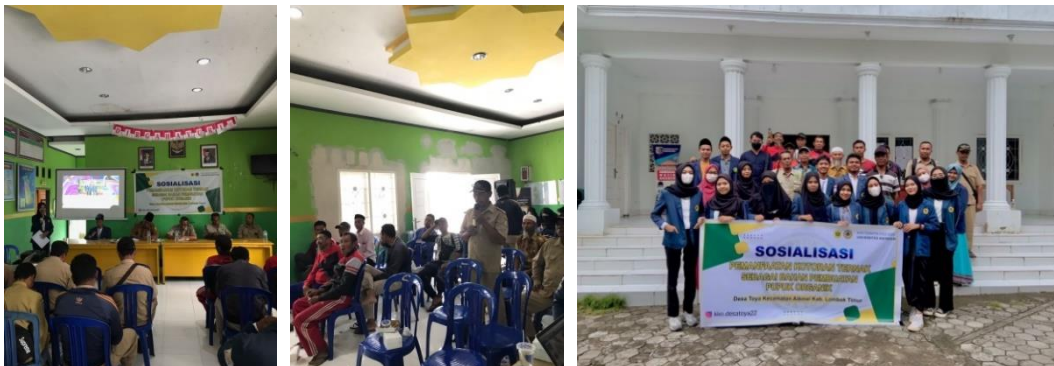
Gambar 3. Sosialisasi pemanfaatan kotoran ternak sebagai bahan pembuatan pupuk organik

Hasil kegiatan sosialisasi yang diharapkan adalah warga khususnya petani mampu mengimplementasikan materi yang telah didapatkan pada kegiatan sosialisasi secara langsung di lahan pertanian. Di lain pihak, peternak juga dapat bekerja sama dengan petani untuk memanfaatkan kotoran ternak yang tidak dikelola sehingga dapat diolah untuk menjadi produk yang dapat meningkatkan keuntungan bersama, baik bagi petani, peternak, maupun lingkungan.