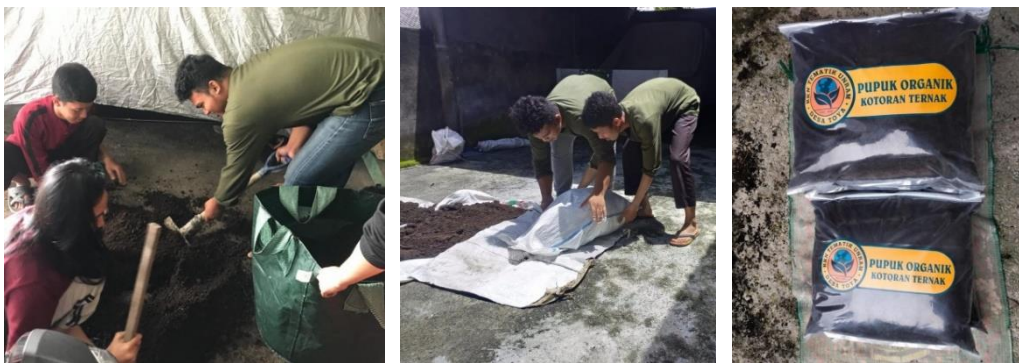
Gambar 2. Proses pembuatan dan produk pupuk organik

cukup waktu hingga seminggu setelah pembuatan, pupuk akan berbentuk seperti tanah dan tidak memiliki bau. Hal ini menunjukkan bahwa pupuk organik telah siap untuk dikemas dan dipergunakan. Hasil dari pembuatan pupuk organik ini diharapkan dapat bermanfaat untuk warga sekitar dan nantinya dapat diperjualbelikan sehingga meningkatkan ekonomi warga. Hasil dari pembuatan pupuk organik ini diharapkan dapat bermanfaat untuk warga sekitar dan nantinya dapat diperjualbelikan. Kotoran sapi, kambing maupun ayam yang diperoleh dari para peternak sebagai bahan utama pembuatan pupuk organik akan memiliki nilai jual yang kemudian dapat memunculkan usaha lain yang dapat berkembang. Hasil pupuk tersebut nantinya akan bermanfaat bagi petani dan pekebun untuk kesuburan tanah dan kualitas tumbuhannya sehingga dapat meningkatkan daya beli masyarakat.