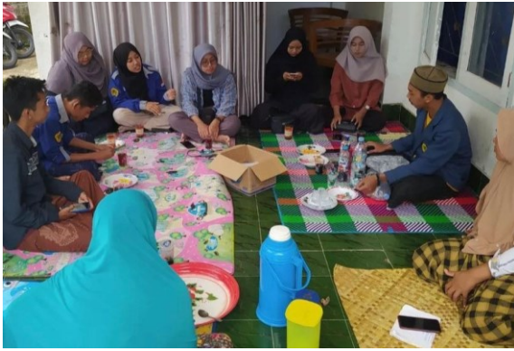
Gambar 6. Sosialisasi pembuatan ecobrick di dusun sebuta