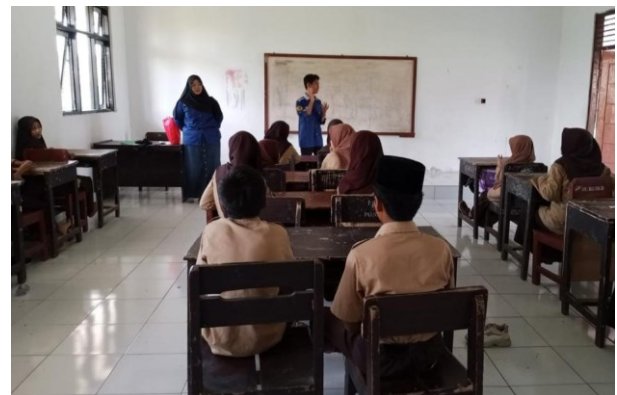
Gambar 4. Edukasi zero waste dan ecobrick di SMPN 8 Pujut

Projek Penguatan Profil Pelajar Pancasila yang salah satu bab materinya mengenai sampah. Hal ini digunakan untuk mendukung anak-anak sekolah tentang sampah, pengelolaan sampah, dan ecobrick ini sendiri. Sosialisasi ini dilakukan dengan metode ceramah dan mendemonstrasikan langsung tahapan pembuatan ecobrick . Sosialisasi ini dilakukan pada bulan Januari 2023 hingga bulan Februari 2023. Dengan jangka waktu tersebut didapatkan produk hasil ecobrick ini yaitu berupa kursi yang dapat digunakan di taman sekolah atau rumah-rumah warga. Sosialisasi ini disambut dengan baik oleh warga setempat begitupun dengan anak-anak sekolah karena mendapatkan ilmu yang baru mengenai pengelolaan sampah.