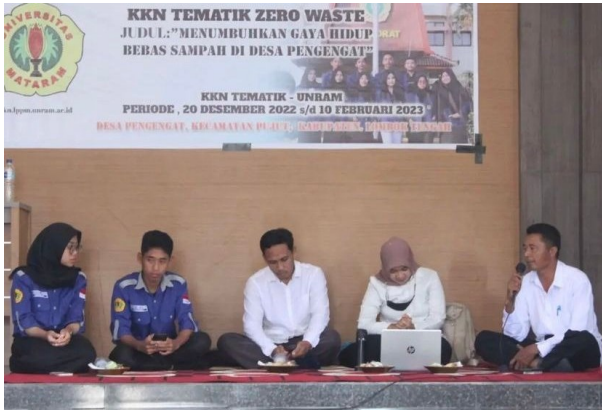
Gambar 2. Sosialisasi zero waste oleh DLHK NTB

ceramah dan demonstrasi langsung agar masyarakat paham tahap pembuatannya.