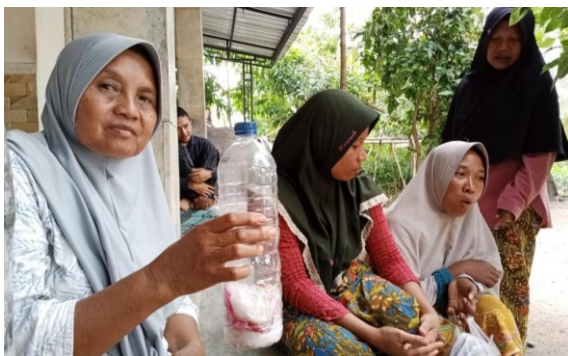
Gambar 7. Demonstrasi pembuat ecobrick di dusun sebuta

Pembuatan ecobrick dilakukan dengan pengumpulan sampah plastik seperti kantong plastik, plastik bungkus jajan, plastik bungkus deterjen dll. Plastik-plastik tersebut dibersihkan dan dikeringkan agar kotorannya tidak membusuk didalam botol. Botol plastik disiapkan dengan ukuran dan bentuk yang sama. Plastik yang sudah bersih dan kering kemudian diguntik kecil kecil untuk memudahkan pemadatan di dalam botol. Kayu berbentuk mulat digunakan untuk membantu pemadatan plastik di dalam botol. Jika botol sudah padat kemudian disusun membentuk susutu yang hendak dibuat, dalam hal ini dibuat kursi. Botol disusun membentuk kursi kemudian direkatkan. Setelah membentuk kursi kemudian dilakukan penghiasan pada karya tersebut agar lebih menarik.