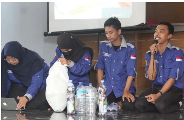
Gambar 3. Sosialisasi dan demonstrasi ecobrick oleh kelompok KKN Desa Pengengat

Projek Penguatan Profil Pelajar Pancasila yang salah satu bab materinya mengenai sampah. Hal ini digunakan untuk mendukung anak-anak sekolah tentang sampah, pengelolaan sampah, dan ecobrick ini sendiri. Sosialisasi ini dilakukan dengan metode ceramah dan mendemonstrasikan langsung tahapan pembuatan ecobrick . Sosialisasi ini dilakukan pada bulan Januari 2023 hingga bulan Februari 2023. Dengan jangka waktu tersebut didapatkan produk hasil ecobrick ini yaitu berupa kursi yang dapat digunakan di taman sekolah atau rumah-rumah warga. Sosialisasi ini disambut dengan baik oleh warga setempat begitupun dengan anak-anak sekolah karena mendapatkan ilmu yang baru mengenai pengelolaan sampah.