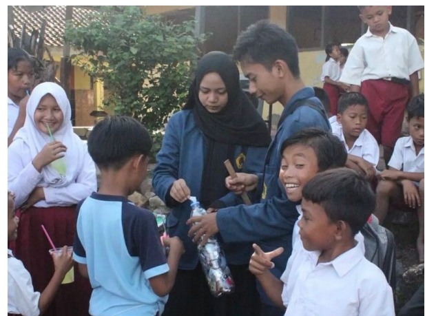
Gambar 5. Demonstrasi pembuatan ecobrick di SDN Pengengat

Edukasi dan demonstrasi ecobrick kemudian dilakukan di setiap dusun dan sekolah yang ada di desa Pengengat. Edukasi di setiap dusun dan sekolah ini bertujuan agar seluruh lapisan masyarakat yang ada di desa Pengengat mendapatkan informasi mengenai ecobrick ini. Terdapat 11 dusun di desa Pengengat, 3 sekolah Negeri dan beberapa sekolah swasta. Pengabdian ini berfokus di setiap dusun dan 2 sekolah negeri yang terdiri dari SDN Pengengat dan SMPN 8 Pujut. Edukasi setiap dusun dilakukan setiap jam 14.00 WITA dengan hari yang berbeda-beda setiap dusunnya. Edukasi di sekolah dilakukan pada saat mata pelajaran P5 yaitu