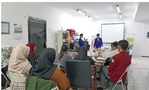
Gambar 2. Dokumentasi saat pelatihan dilaksanakan luring

Kegiatan pelatihan ini dilakukan intensif selama 16 kali pertemuan. Sesuai dengan model yang diterapkan, pelatihan ini dilaksanakan secara daring dan luring. Setiap minggu kelas luring diadakan pada hari Selasa pukul selesai jam kantor yakni pukul 16.00-17.00 WIB, sedangkan kelas luring diadakan pukul 19.00-20.00 WIB dengan jadwal hari yang fleksibel menyesuaikan peserta. Total kelas luring yang telah dilaksanakan sebanyak 10 kali, sedangkan kelas daring sebanyak 4 kali. Dua pertemuan lainnya digunakan untuk evaluasi yang dilaksanakan secara daring. Pelatihan ini menggunakan bahan ajar yang telah disusun oleh tim yang disesuaikan dengan kebutuhan pegawai PT. Xuilong Outdoor Jombang.