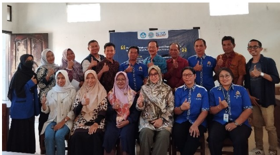
Gambar 7. Foto bersama peserta pelatihan

Setelah pelatihan dilaksanakan, para peserta masih terus mendapat pendampingan oleh tim PKM. Hal ini bertujuan untuk memastikan bahwa apa yang telah dipelajari selama pelatihan dapat diterapkan dalam kegiatan pembelajaran.