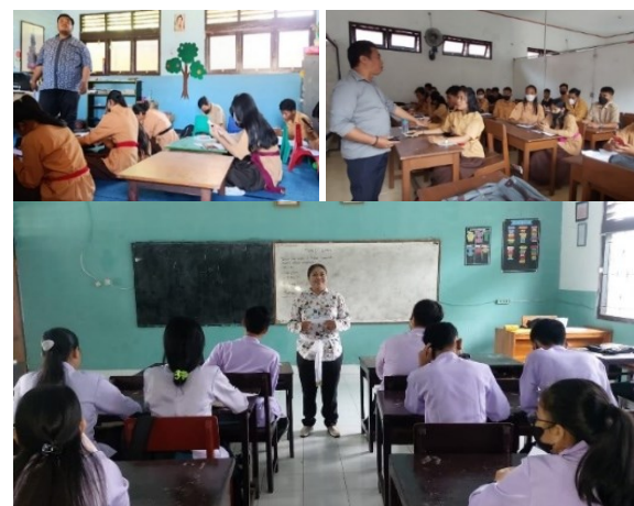
Gambar 1. Dokumentasi Proses Pembelajaran di Pasraman Widya Dharma Sumbawa

dan informasi tentang ketiga jenis asesmen tersebut. Maka guru-guru pasraman masih belum mampu menerapkannya secara optimal dalam pembelajaran. Mereka kesulitan memahami prinsip-prinsip asesmen dalam pembelajaran sesuai tuntutan kurikulum merdeka belajar. Guru-guru ini belum dapat mengintegrasikan asesmen dengan baik dalam proses belajar peserta didik secara berkesinambungan. Selama ini, mereka hanya melakukan asesmen di setiap akhir pembelajaran atau dikenal dengan asesmen sumatif. Pelaksanaannya pun masih bersifat konvensional menggunakan kertas ( paper-based test ). Sehingga membutuhkan waktu dan tenaga ekstra bagi guru untuk memeriksa dan memberikan umpan balik kepada peserta didiknya. Minimnya penguasaan guru terhadap teknologi informasi dan komunikasi (TIK) membuat mereka tidak mampu memanfaatkannya untuk menunjang proses pelaksanaan asesmen pembelajarannya. Padahal dengan pemanfaatan TIK, maka kegiatan asesmen pembelajaran yang biasanya dilakukan secara konvensional dapat menjadi lebih menarik, lebih canggih, efektif dan efisien (Yahya, et all , 2021).