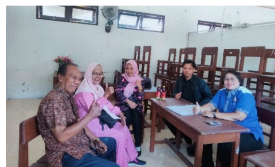
Gambar 3. Koordinasi dengan Mitra

Setelah berkoordinasi dengan mitra, selanjutnya menyiapkan alat dan bahan kegiatan pelatihan, Menyusun materi pelatihan dan menyiapkan narasumber yang harus menyampaikan materi tersebut. Kemudian dilakukan FGD persiapan kegiatan yang dihadiri oleh narasumber dan juga mahasiswa calon pendamping guru saat kegiatan pelatihan berlangsung. Hal ini bertujuan untuk memastikan bahwa mereka memahami rencana alur kegiatan pelatihan dengan baik. Selain itu juga untuk memastikan mahasiswa memahami materi yang akan disampaikan narasumber sehingga dapat mendampingi guru dengan baik.