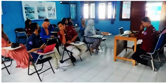
Gambar 4. FGD Persiapan Kegiatan bersama Narasumber dan Mahasiswa