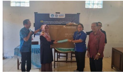
Gambar 5. Penyerahan bantuan dari Tim PKM ke Pasraman