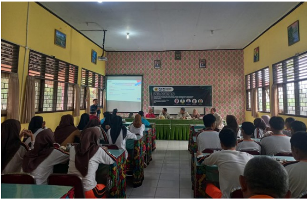
Gambar 1. Sambutan Kepala Sekolah SMAN 1 Gunungsari

Peserta yang mengikuti kegiatan pelatihan ini cukup banyak. Mereka yang terlibat adalah perwakilan tiap kelas XII program MIPA dengan total jumlah peserta sebanyak 25 orang. Siswa yang mengikuti pengabdian disajikan dalam tabel 1 berikut ini.